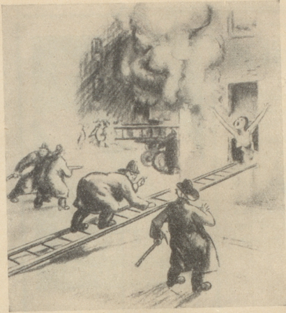
Die Dame, die unbedingt mit der grossen Leiter gerettet werden wollte.