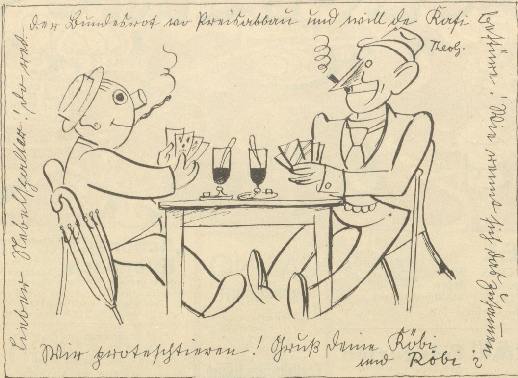
Köbi und Röbi zur Kaffeesteuer