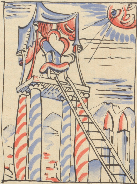
Ehrwürdig'er Sessel ist das Ziel. Ihn zu besitzen ist kein Spiel.