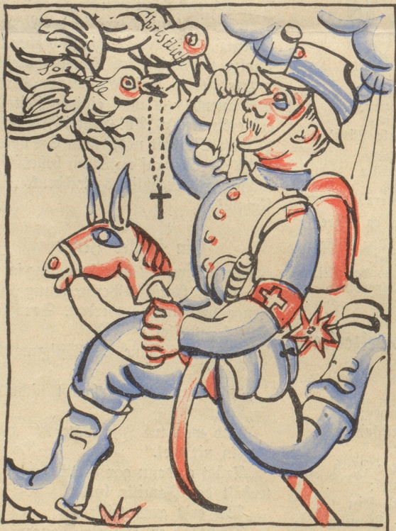
Es eilt trotz Sabel, Schulsack, Föhn und Rabekreis der wackre Höhn.