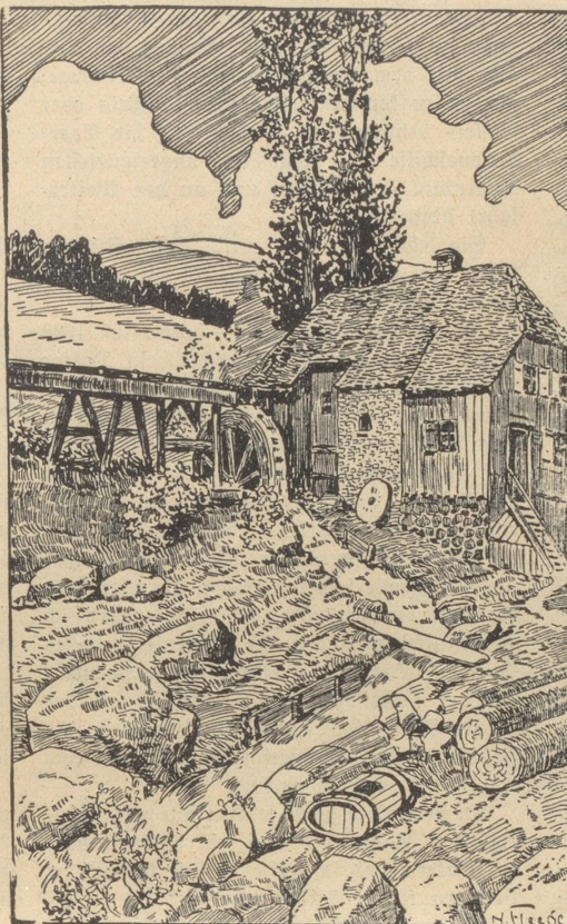
Wo ist der Müller?