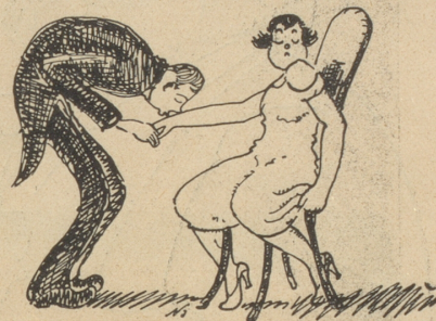
„Über mein Herr! bitte nicht so innig — so Pfyfferisch!“