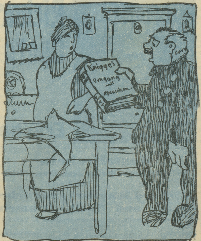
„Oho! Knigges „Umgang mit Menschen“!“