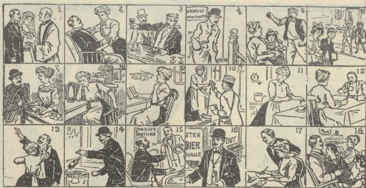
Diese 18 Bilder erzählen eine ganze Geschichte. Ein Kind kann sie verstehen.