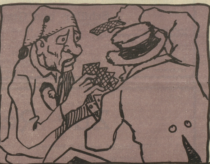
Noch einmal Trumpf!