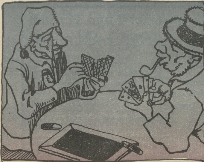
Sehet, wie fein und lieblich ist es, wenn zwei liebe Nachbarn mit einander jassen.