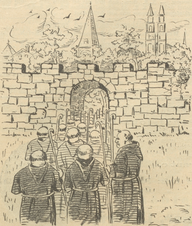
Einst zogen die „Barfüßer“ nach Zürich;