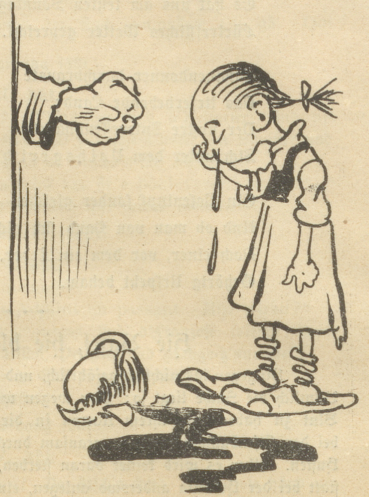
Faust x Margarethe.