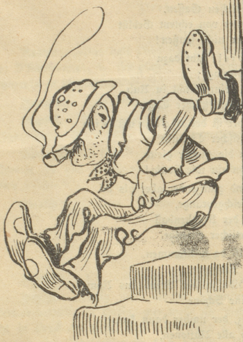
Der fliegende Holländer.