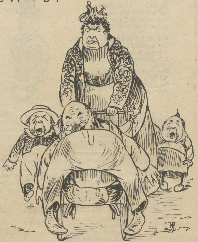
So kehren sie heim.