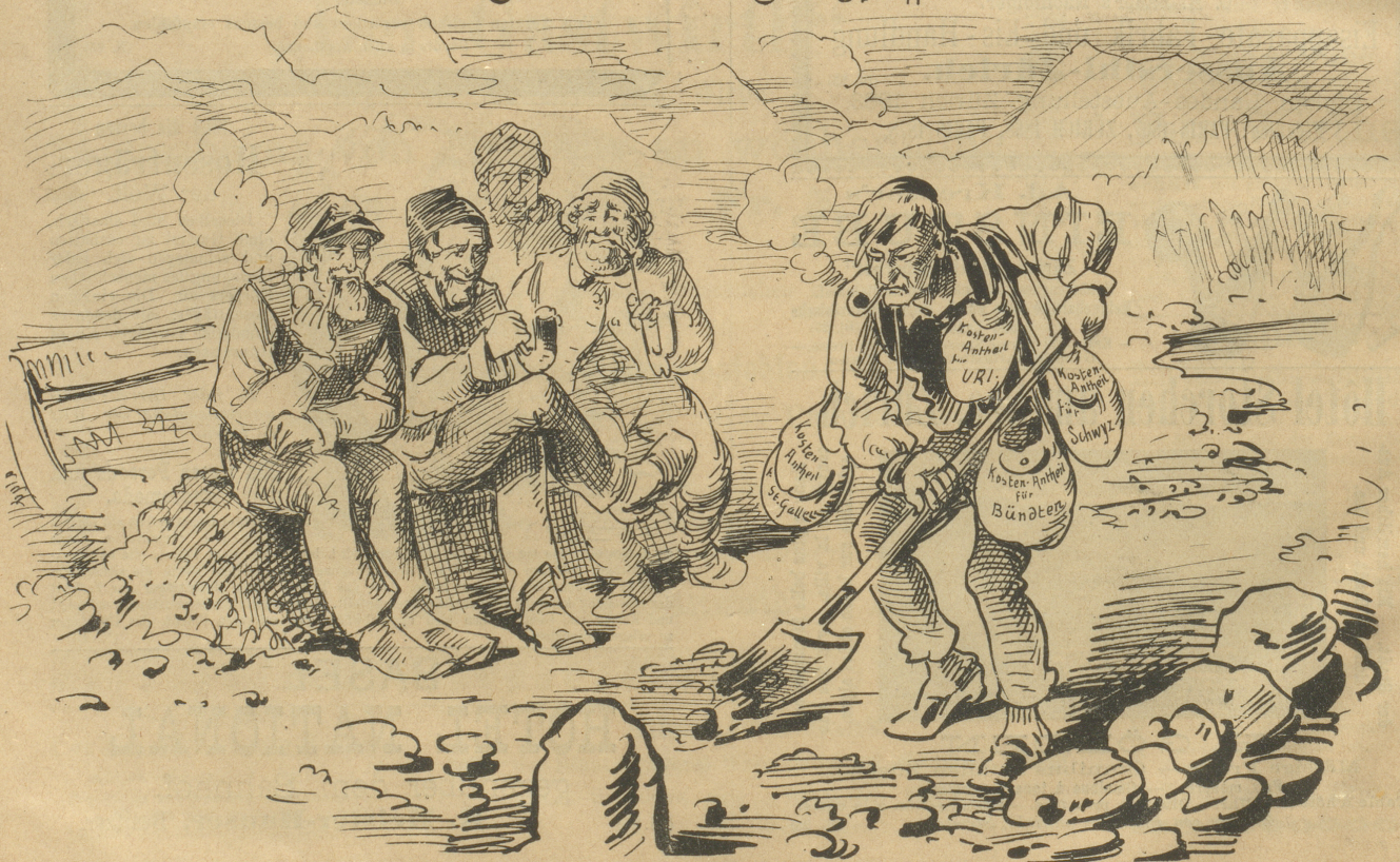
und wird sie auch sofort erhalten, sobald es etwas guten Willen zeigt.