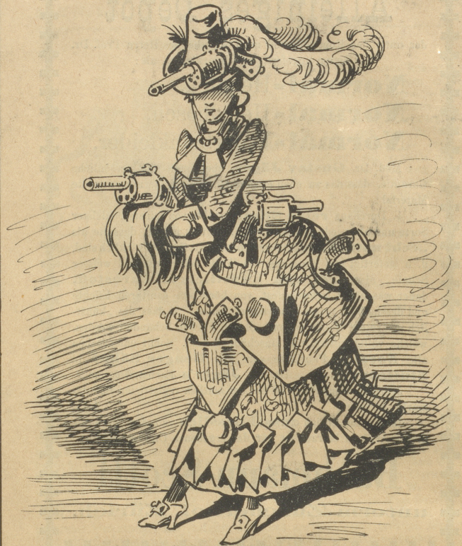
mit Schießgewehr, denn es könnt' geladen sein.