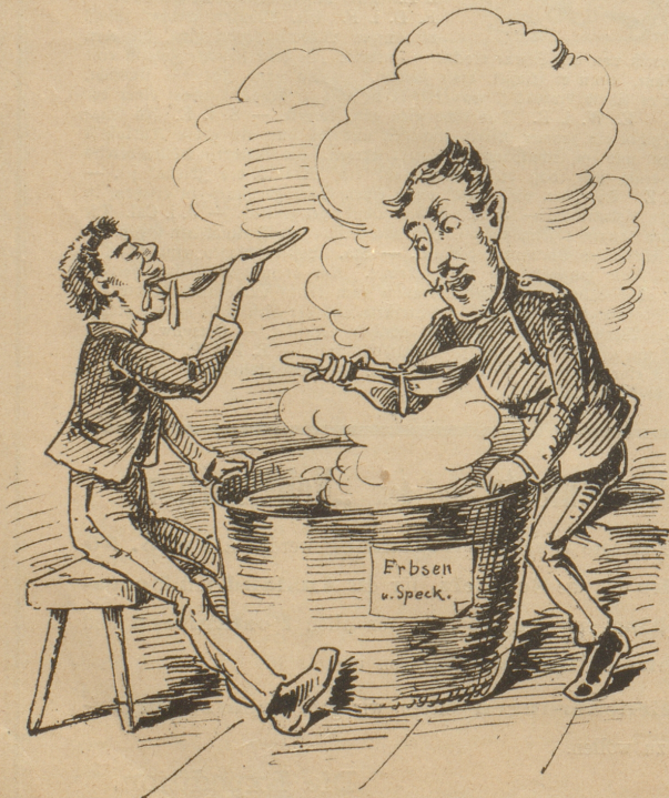
Diese Bedenken hofft man jedoch durch Anwendung verfahrensmäßig erprobter Mittel zu beseitigen.