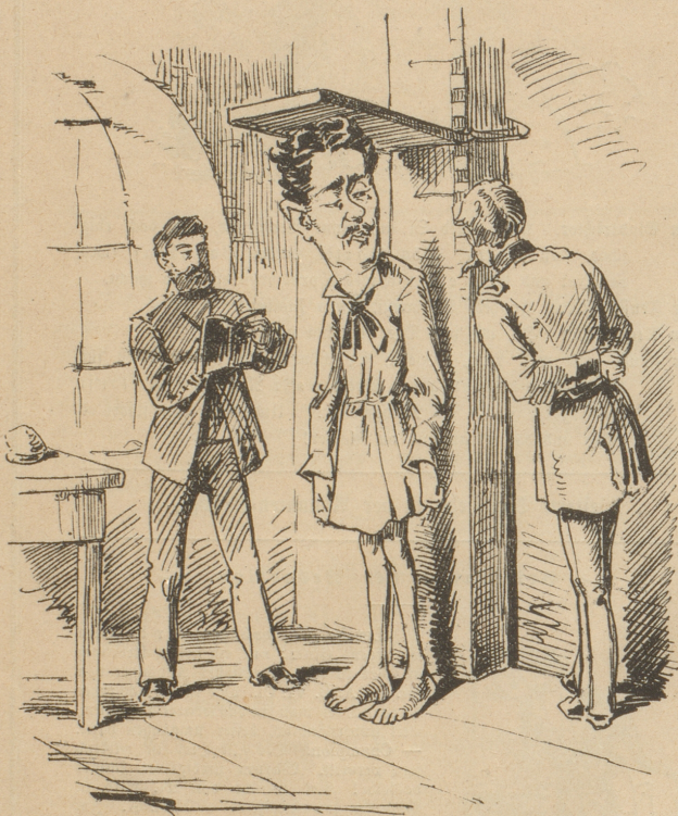
In Folge der schwankenden Weltlage beschließt der Bundesrath gleichfalls die geeigneten Maßnahmen.