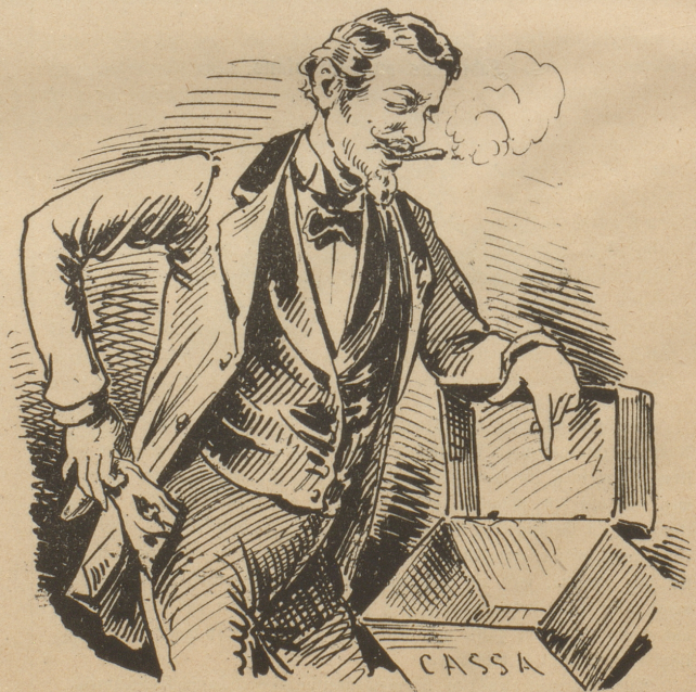
So daß wir stark genug sind, habgierigen Feinden eine gewaltige Täuschung zu bereiten.