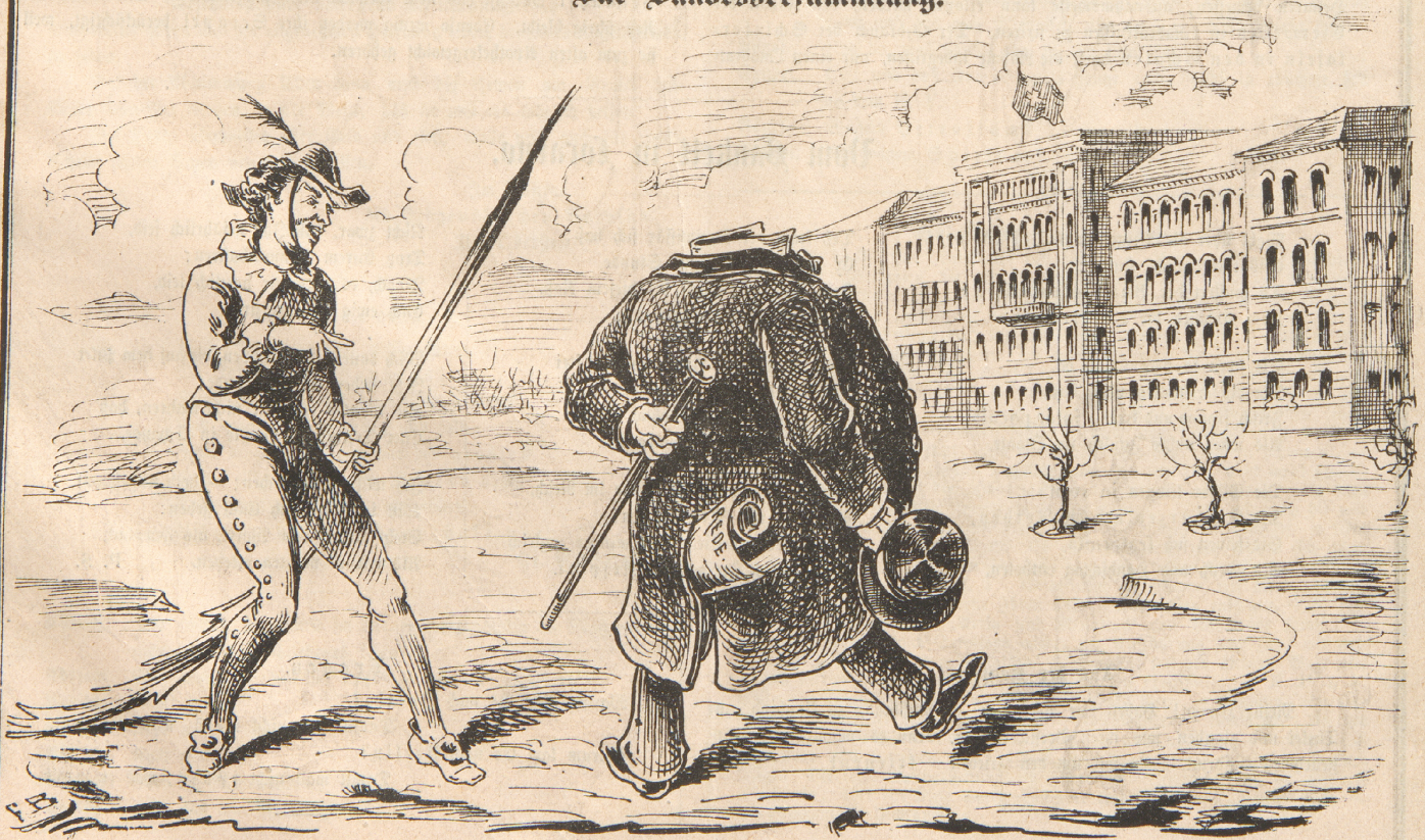
Nebelspalter. Heh, Herr Nationalrath, schnell kehren Sie um, Sie haben ja den Kopf zu Hause gelassen.