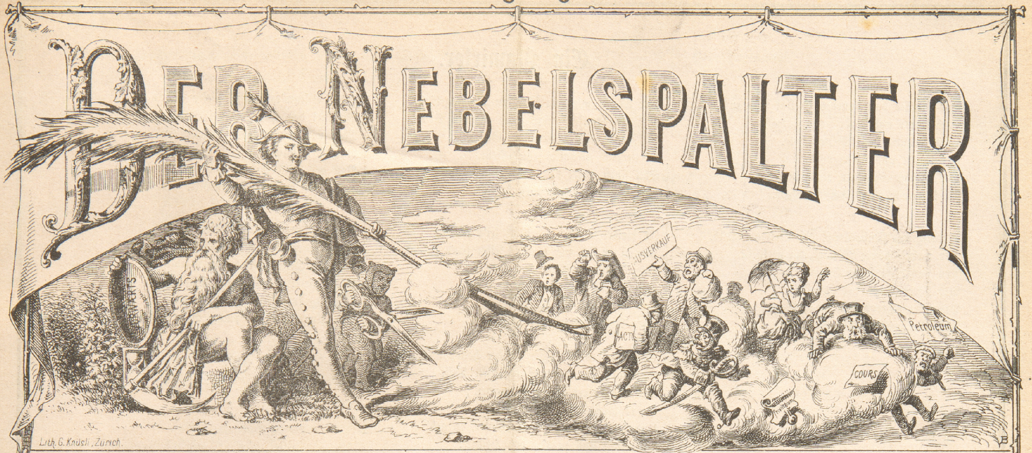
Lith. G. Knüsch, Zürich.