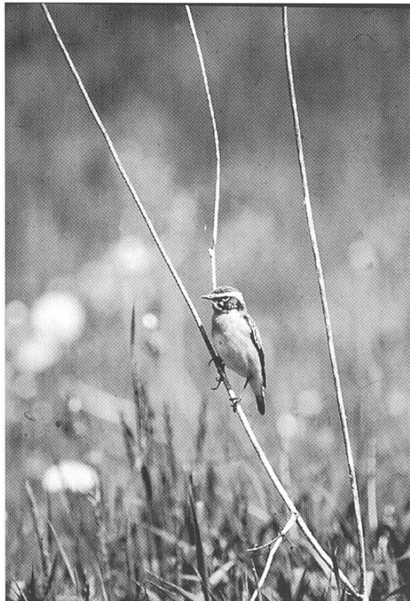
Abbildung 1: Braunkehlchen, Saxicola rubetra . Letzte Brutnach- weise im Kanton Schaffhausen Anfang 70er Jahre.

Leider ist das Wissen über die Vogelwelt der Region Schaffhausen vor allem aus dem letzten Jahrhundert lückenhaft. Die Ornithologische Arbeitsgruppe Schaffhausen möchte im Zusammenhang mit einer geplanten Veröffentlichung über die Vogelwelt der Region Schaffhausen auch ein Kapitel über die Veränderung der Avifauna in den letzten 150 Jahren schreiben. Dazu sind wir aber auf Ihre Mitarbeit angewiesen! Haben Sie noch aus Ihrer Jugendzeit oder von Ihren Vorfahren ornithologische Aufzeichnungen? Oder besitzen Sie alte Zeitungsausschnitte, Zeitschriften oder Bücher mit Angaben über die Schaffhauser Vögel seit 1850?