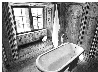
Gästebadezimmer im Türalihus.

herrschaftlichen Bürgerhaus des lokalen Adels bot sich uns die Gelegenheit, die historischen Gebäude auch von Innen zu besichtigen. Während das Bauerhaus von 1451 noch im Zustand der Bauuntersuchungen war, konnten wir im Türalihus einen Eindruck erhalten, wie es sich in einem Haus, das als «Ferien im Baudenkmal» (Schweizer Heimatschutz) angeboten wird, leben lässt.