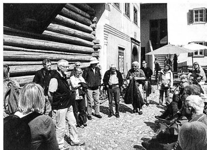
Auf dem Dorfplatz von Valendas.

Am Sonntag, 20. August 2017, führte uns die Exkursion nach Valendas östlich von Ilanz. «Valendas gehört zu den noch wenigen authentisch erhaltenen Dörfern Graubündens. Doch wie viele Bergdörfer in peripherer Lage hat auch Valendas mit der Abwanderung und all den damit zusammenhängenden Problemen zu kämpfen. Um den dramatischen Abwärtstrend zu stoppen, haben Ortsansässige vor rund zehn Jahren ein Dorfentwicklungsprojekt [Valendas Impuls] gestartet, das weit über die Kantonsgrenzen hinaus Beachtung fand. Der Bündner Heimatschutz hat die Renaissance des Dorfes Valendas von Beginn weg unterstützt und begleitet» (Köbi Gantenbein, Chefredaktor «Hochparterre»).