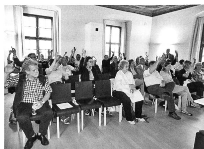
Mitgliederversammlung beim Abstimmen.

schichte, rief in ihrem Votum die Mitglieder auf, sich verstärkt um die Werbung weiterer Mitglieder zu kümmern. Die wirksamste Form sei immer noch das aktive Einwerben von neuen Mitgliedern im Bekanntenkreis. Nach der Mitgliederversammlung setzten sich die Teilnehmenden im Restaurant Marsöl zu Tisch, um gemeinsam das