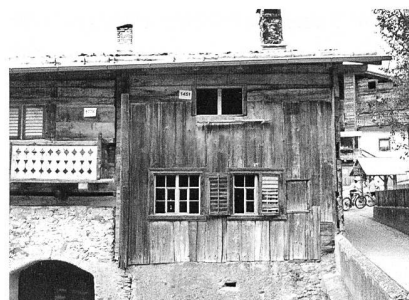
Hausteil von 1451.