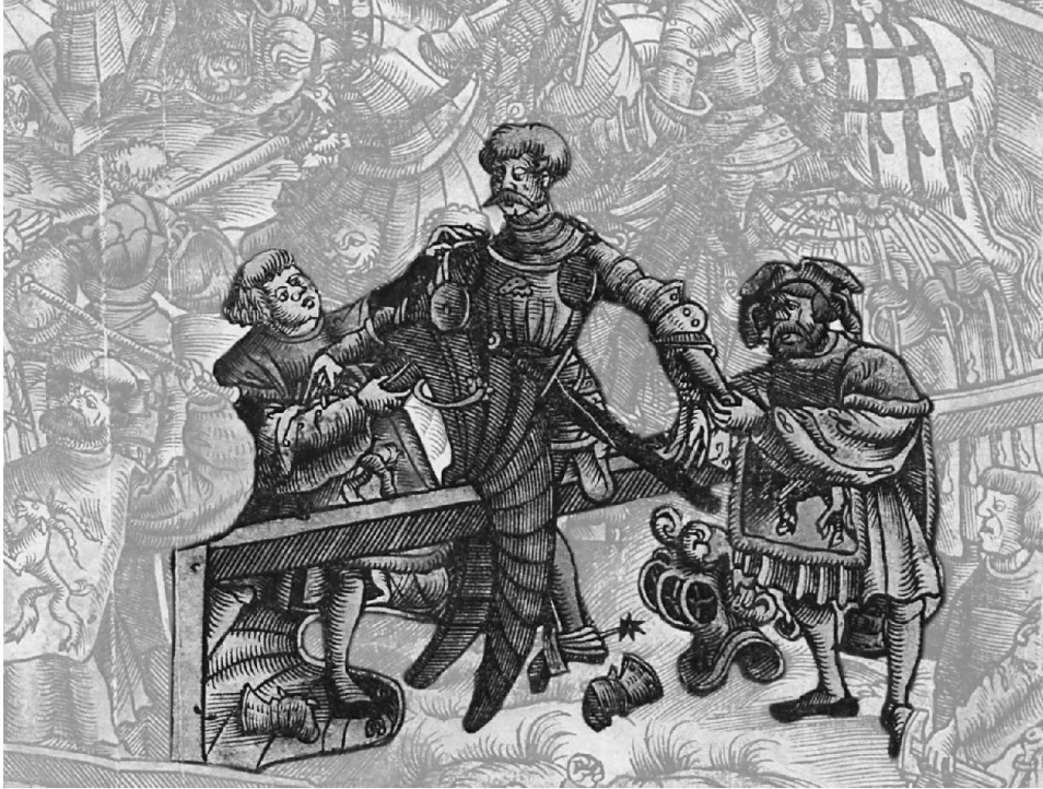
5: Der Bestrafte auf der Schranke verliert sein Pferd und sein Turnierzeug. – Ausschnitt aus Abb. 2.