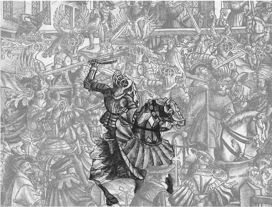
3: Ein Ritter wird für sein unehrenhaftes Verhalten verprügelt. – Ausschnitt aus Abb. 2.

bahn gesetzt. Aus andern Quellen wissen wir, dass der Bestrafte sein Pferd und sein Turnierzeug verlor und der Erlös aus beidem an die Knappen oder Spielleute verteilt wurde.