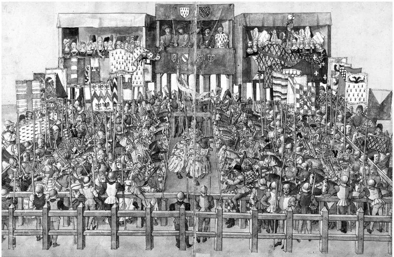
1: Barthélemy d'Eyck, Beginn des Kolbenturniers, um 1460. Zwischen den Seilen der Ehrenritter (Ringrichter), zu beiden Seiten die zwei Mannschaften, im vergitterten Kolbenturnierhelm die Kämpfer, mit den Standarten die Wappenknechte.

von Schaffhausen gesehen haben. Denn in seinem Traktat über die Art und Weise, wie man ein Turnier veranstalten solle, erwähnt er im Vorwort, dass er sich v. a. an Turnieren orientiert habe, wie sie am Rhein und in Deutschland gepflegt werden. Sein überragendes, 1460 von Barthélemy d'Eyck illustriertes Turnierbuch erscheint denn auch zu einem guten Teil wie die Bebilderung der beiden spanischen Berichte über die Schaffhauser Turniere (Abb. 1). Auffallend ist, dass diese drei farbenreichen Turnierschilderungen von Fremden stammen, wogegen die regionalen Texte des Konstanzer Chronisten Gebhard Dacher und des Ritters Rudolf von Eptingen über die Schaffhauser Turniere relativ dürr bleiben. Das mag einerseits