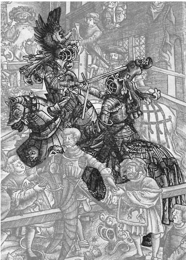
6: Im Nachturnier kämpft jeder gegen jeden und versucht, dem Gegner die Helmzier vom Kopf zu schlagen. – Ausschnitt aus Abb. 2.

Endlich folgt die letzte Phase, das so genannte «Nachturnier» (Abb. 6). Anstatt mit Kolben wird nun mit dem stumpfen Schwert gekämpft. Jeder kämpft gegen jeden. Ziel ist es, dem Gegner die Helmzier vom Kopf zu schlagen.