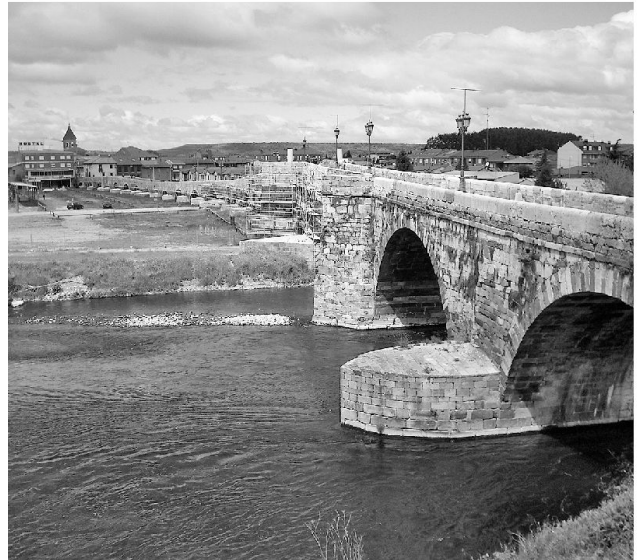
8: Die Brücke über den Orbigo, heute.

Der Kampf sollte in der Feldrüstung ( arneses de guerra ) stattfinden, d.h. mit scharfen Lanzen, ohne Tartsche und mit dem zweiteiligem Kopfschutz, bestehend aus Schaller und Bart (Abb. 9 und 10). Fremden Herausforderer wurde in Einzelfällen eine sicherere Rüstung mit Stechhelm und