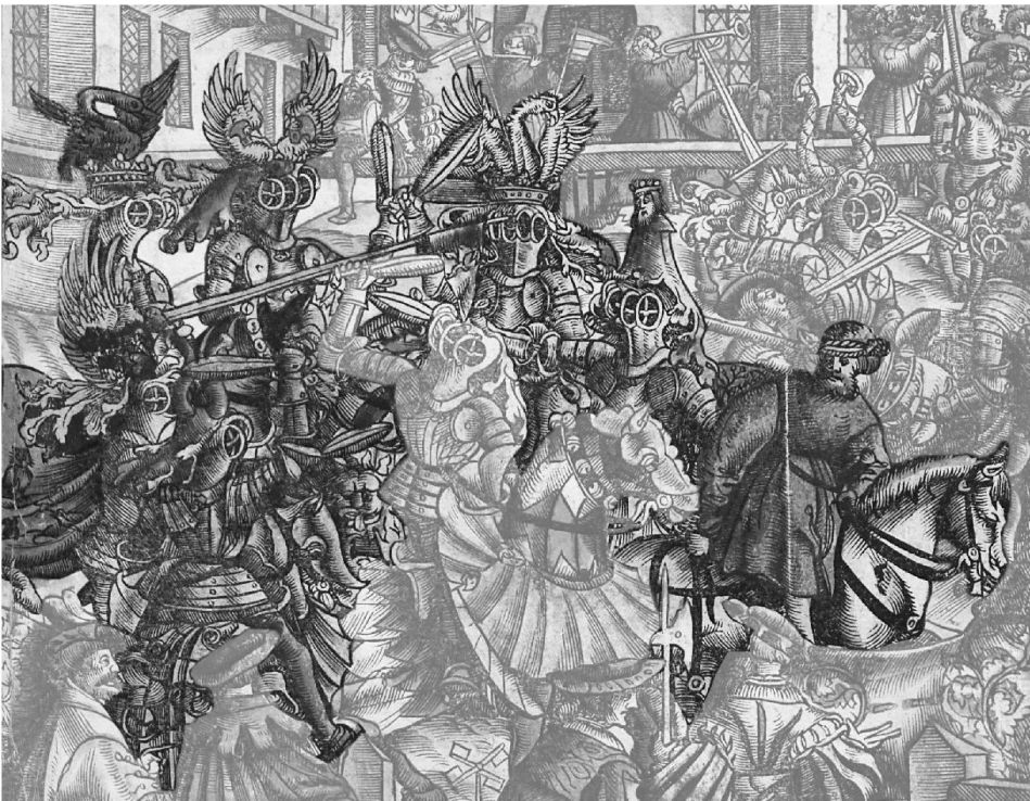
4: Mehrere Edelleute schlagen mit Kolben auf den Missetäter ein. – Ausschnitt aus Abb. 2.