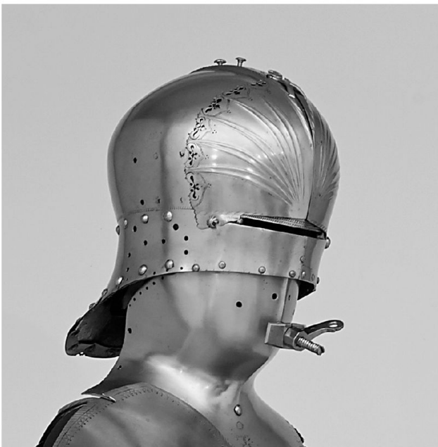
10: Rennhut in der Form einer Schaller mit Bart.