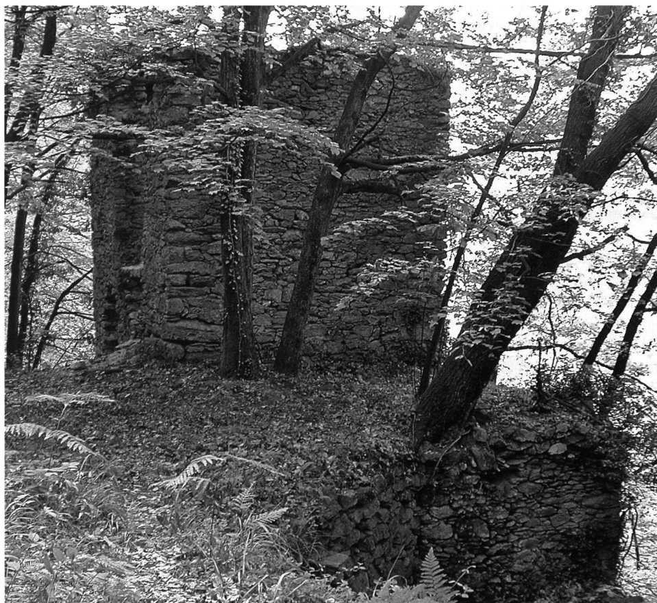
1: Riazzino. La Torre.

Ne sono risultati oltre 400 oggetti, distribuiti sul territorio di 237 comuni. Va però ricordato che tale cifra dipende essenzialmente dal numero elevato di toponimi comprendenti una delle diverse voci prese in esame, ma in realtà spesso con tutt'altro significato. Alcuni oggetti sono risultati inoltre avere più di una denominazione.