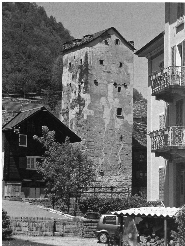
2: Chironico. La Torre dei Pedrini.

Le torri hanno generalmente una pianta quadrangolare (quadrata o rettangolare). Esiste solo un esempio di torre a base rotonda, quella di Campo Blenio. La struttura (diam. 7 m), posta su un piccolo promontorio sul fiume