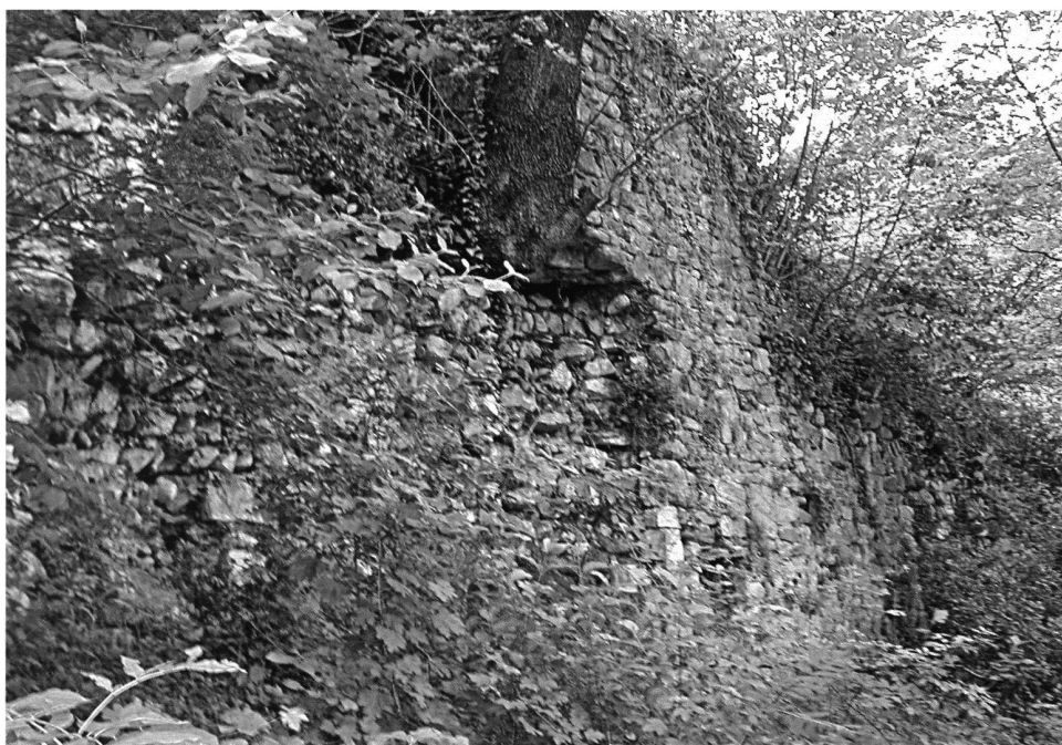
5: Castel San Pietro. Tratto del muro di cinta – Reste der Umfassungsmauer der Burg von Castel San Pietro.

pianta pentagonale (misure ortogonali 5 \times 7 m; h max. 4 m), con il vertice verso sud. Al suo interno è visibile parzialmente un piano lastricato.