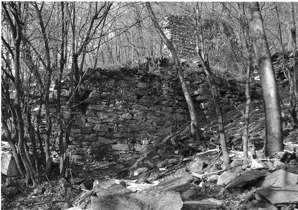
3: Bironico. Tratti delle due cinte murarie – Reste der Umfassungsmauer der Burg von Bironico.

(4 × 4 m; h ca. 12 m). Per il momento ancora conservata (h ca. 3 m), ma fortemente minacciata dalla vegetazione che non permette di rilevarne i dettagli, è anche la Torre di Cresciano ( Tor de la Corsénca ). Costruita su un alto sperone di roccia sul versante orientale della valle, è di difficile accesso.