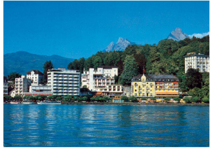
Alt und Neu am Quai von Brunnen; die intensive Bautätigkeit der Hochkonjunktur hat ihre Spuren hinterlassen.