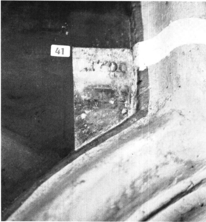
Abbildung 18 Ingenbohl, Kapelle St. Wendelin, Unterschönenbuch. Probefreilegung im Chor mit dem Entstehungsdatum der Wandmalereien 1709.

noch ihre Bienenwabenverglasung, einen Tonplattenboden und die oben erwähnte, bedeutend bessere zweite Fassung der Altäre. Dieser Zustand wird den Innenraum zu einer qualitätvollen Einheit zusammenfügen, während das Äussere nach wie vor sein barockes Gesicht, das nie wesentlich verändert wurde, beibehält.