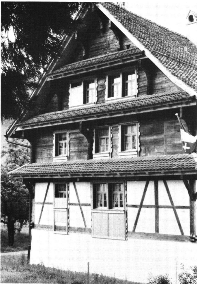
Abbildung 28 Morschach, Pfarrhaus. Die restaurierte Rückfront.