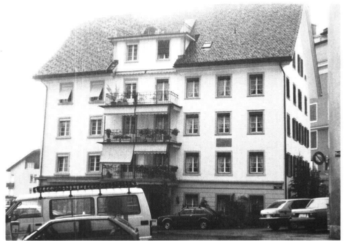
Abbildung 37 Einsiedeln, Haus Adam und Eva. Die barocke Fassade wurde im späten 19. Jahrhundert umgestaltet. Aus dieser Zeit stammt auch der Balkonvorbau.

Im Kern handelt es sich beim Doppelhaus Adam und Eva um einen Barockbau, der aber im 19. Jahrhundert modernisiert wurde. Der ursprünglich einfache Giebelbau erhielt einen leicht asymmetrisch vorgesetzten Terrassenanbau aus Gusseisen und einen darüber liegenden, flach gedeckten Dachaufbau. Dadurch wurde die ehemals durchlaufende Trauflinie durchbrochen.