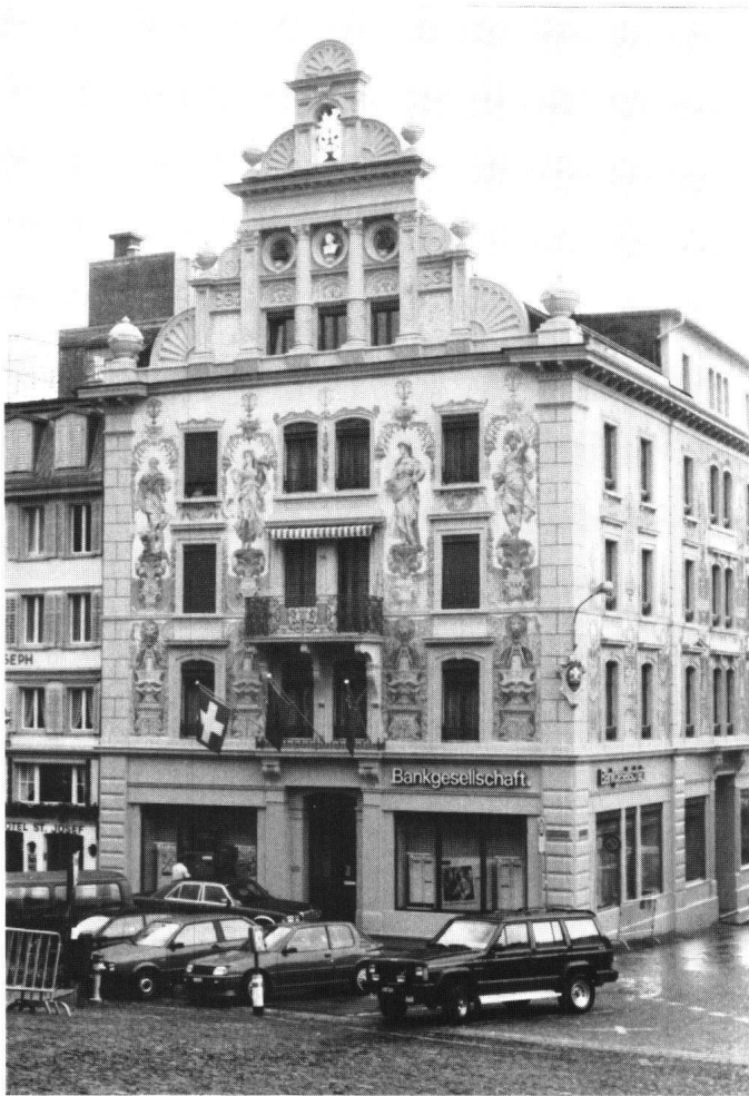
Abbildung 38 Einsiedeln, Haus Ilge. Die Architekturbemalung wurde anhand des Befundes wiederhergestellt. Heute besteht wieder ein Gleichgewicht zwischen der Architekturbemalung und der Camailleu-Malerei in den Zwischenfeldern.

Das bestehende Doppelportal dürfte zum barocken Bestand gehören. Richtlinie für die Restaurierung des Hauses war das Aussehen nach der Umgestaltung des 19. Jahrhunderts. Das Sockelgeschoss erhielt seine nur noch teilweise erhaltenen Putzrillen zurück. Leider musste auf die Rekonstruktion der Fassadenmalerei verzichtet werden, die auf alten Photos noch dokumentiert ist. Trotzdem präsentiert sich die Fassade wieder in einem einheitlichen Zustand, der wesentlich zur Atmosphäre des Platzes beiträgt.