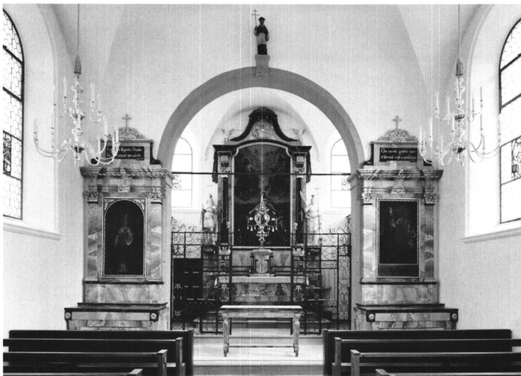
Abbildung 15 Ingenbohl, Dorfkapelle Brunnen. Blick gegen den Chor.

älterer, erhaltengebliebener Teile erneuert. Vom alten Bestand hat sich das bedeutende Hochaltartbild von Justus van Egmont erhalten.