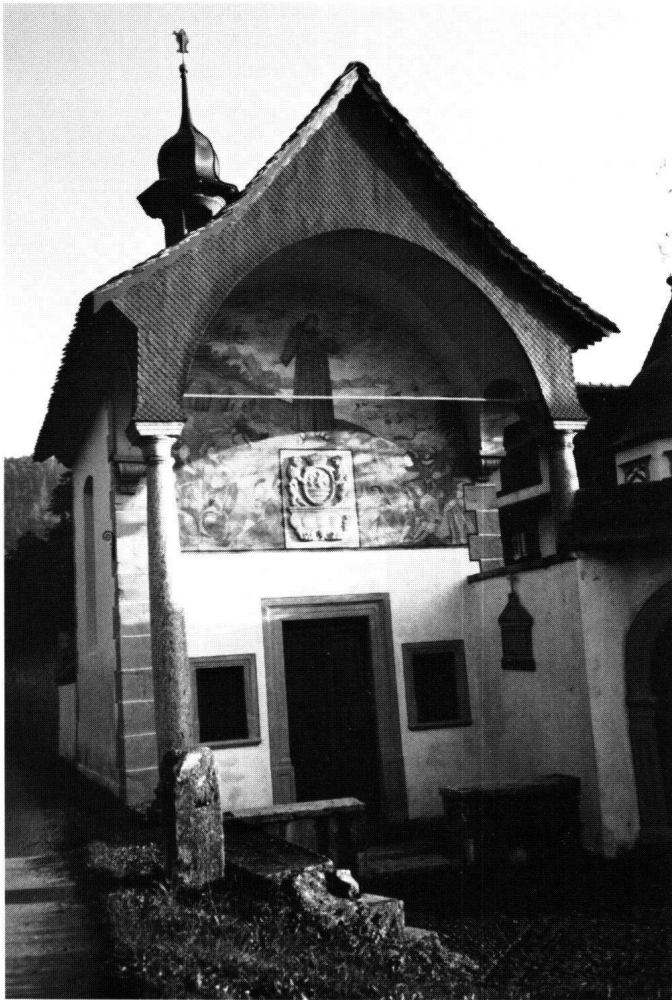
Abbildung 1 Schwyz, Kapelle St. Antonius im Immenfeld. Die Westfront mit dem Wandbild des hl. Antonius.

fernt werden musste also lediglich die letzte Übermalung. Somit präsentiert sich das Bild heute im Zustand des 19. Jahrhunderts, also dem Zustand vor der Übermalung der 50er Jahre. Wappen, Tür- und Fenstereinfassungen sowie die aufgemalten Quader mit hellen Fugenstrichen wurden ergänzt, damit das Bild in der Architektur den nötigen Halt bekam. Der Fassadenputz wurde lediglich gekalkt und die Dachuntersicht nach Befund grau gestrichen. Die Front des Vorzeichens musste neu verschindelt werden. Der Schindelmantel erhielt wiederum seinen oxsenblutroten Anstrich.