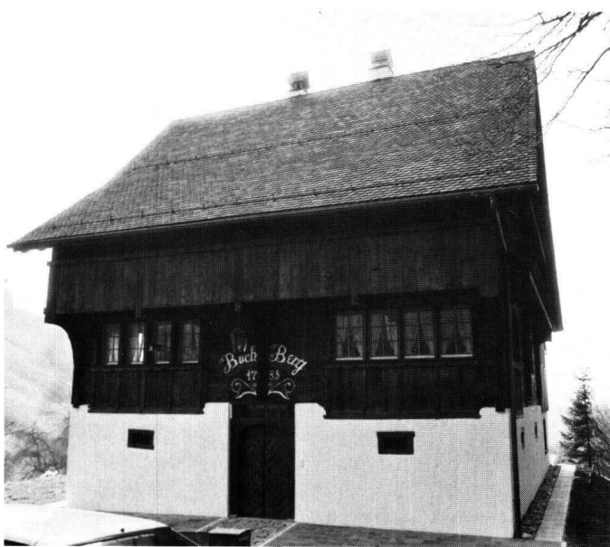
Abbildung 41 Freienbach, Pfäffikon, Buchberg. Die Eingangsfront nach der Restaurierung mit dem Erbauungsdatum 1783.

Der Zugang erfolgt auf der Strassenseite ebenerdig. Als Hauptfront muss wegen der Stellung zur Strasse die Trauf-