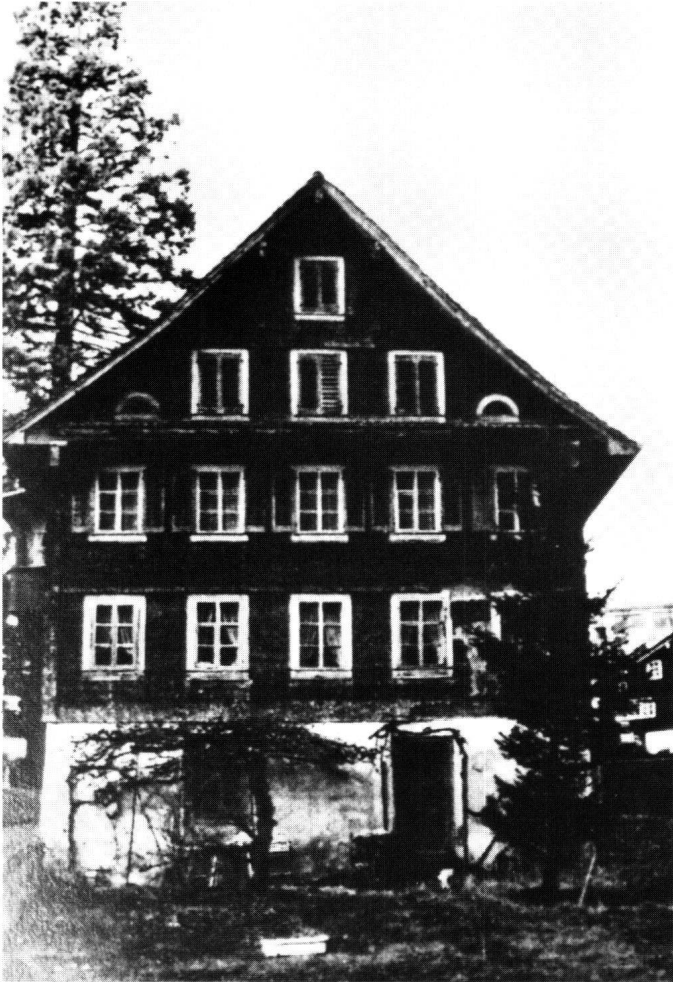
Abbildung 25 Morschach, Pfarrhaus. Die Hauptfront vor der Restaurierung mit regularisierten Fenstern und Schindelmantel.

fand sich im Giebeldreieck das Datum 1685. Typologisch gewann dadurch das Haus noch an Interesse, stellt es doch ein Bindeglied zwischen dem bäuerlichen Holzbau und dem gleichzeitigen Herrschaftshaus dar.