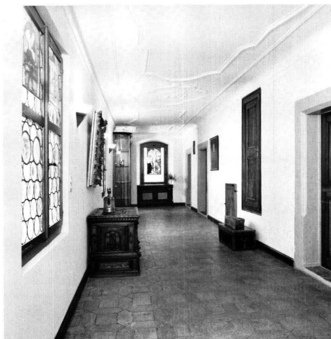
Abbildung 4 Schwyz, Reding-Haus an der Schmiedgasse. Der Ostarm des wieder in seinem ganzen Umfang geöffneten Ganges.

Die wechselhafte Geschichte des Reding-Hauses an der Schmiedgasse konnte mit diesen Massnahmen ein Stück weiter ergründet werden. Wertvollste Hilfe waren dabei die Auszüge aus dem Familienarchiv, die Dr. Niklaus von Reding im Zusammenhang mit der Restaurierung aufgearbeitet hat. Darin sind sämtliche Architekten und Handwerker sowie die Lieferanten der Materialien erwähnt. Es zeigt sich dabei, dass die führenden Kunsthandwerker beigezogen wurden.