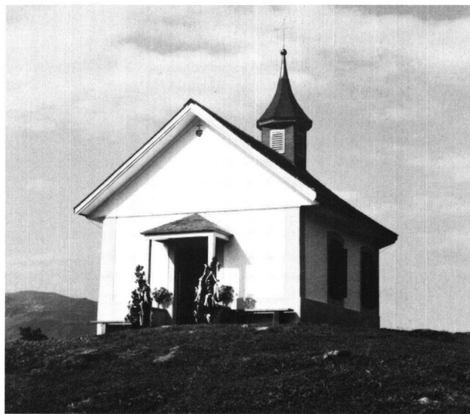
Abbildung 29 Illgau, Herz-Jesu-Kapelle im Hinteren Oberberg. Das Äussere nach der Restaurierung mit dem in seiner Grösse reduzierten Vorzeichen.

Im Innern mussten der Putz und das Gipsgewölbe saniert werden. Hinweise auf eine ältere Holzdecke fanden sich nicht, so dass die bestehende, einfache Tonne erhalten blieb. Das spätklassizistische Altärchen mit dem Leinwandbild wurde auf seine alte Fassung freigelegt. Die Ver-