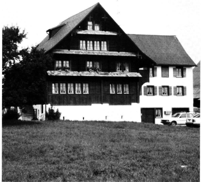
Abbildung 33 Schübelbach, Bauernhaus Bergwies. Die Hauptfront nach der Restaurierung.

Im Innern des Gebäudes blieb die überlieferte Struktur erhalten, die Ausstattung hingegen musste erneuert werden.