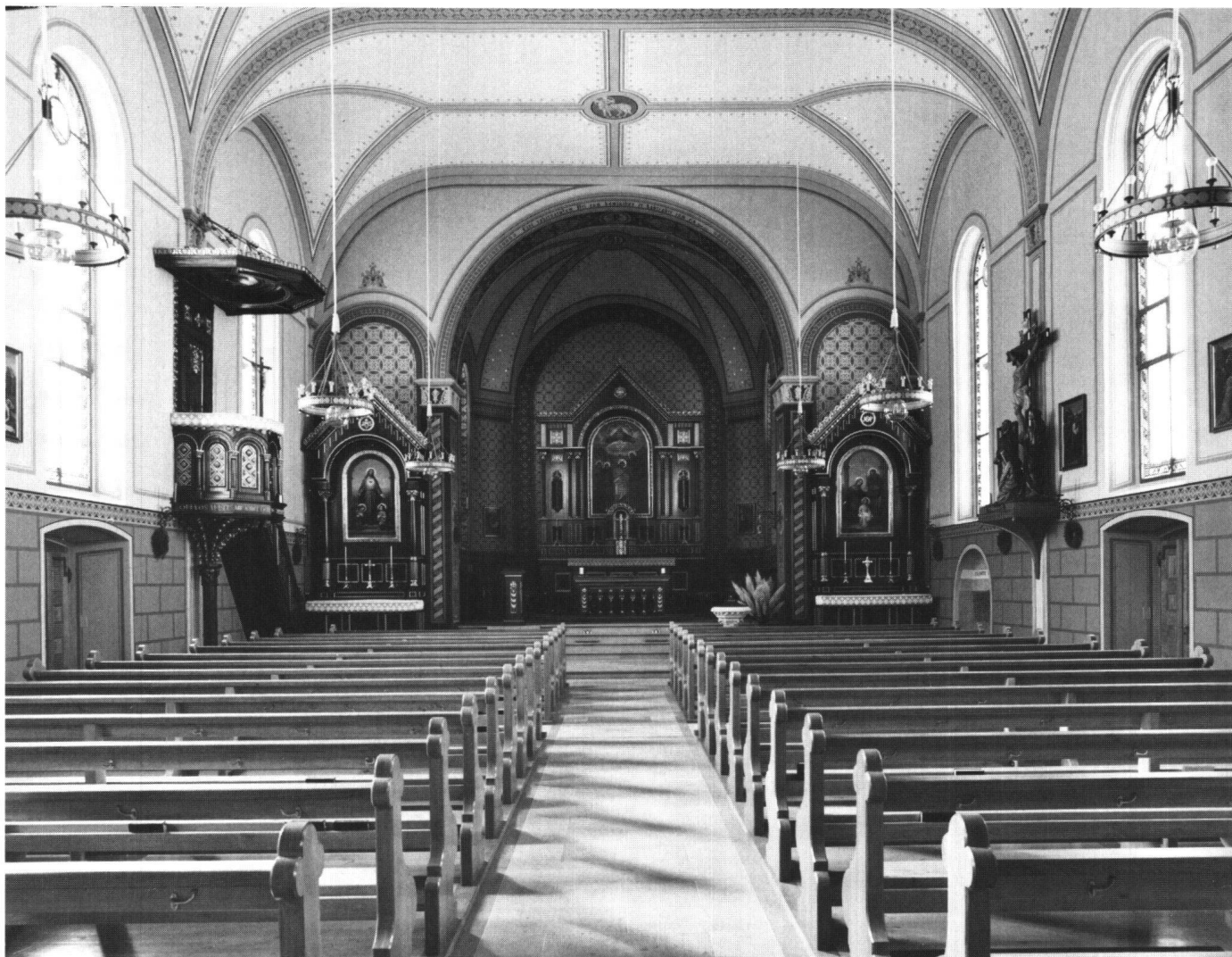
Abbildung 35 Einsiedeln, Egg, Viertelskirche St. Johann. Innenansicht nach der Restaurierung.

sind. Die erwähnten Altarbilder befinden sich wieder an ihrem angestammten Platz. Die Kirchenbänke wurden anhand der Originale, die auf der Empore standen, rekonstruiert. Die Bankdoggen sind analog zur Orgelepore mit einem Eichenmaser versehen.