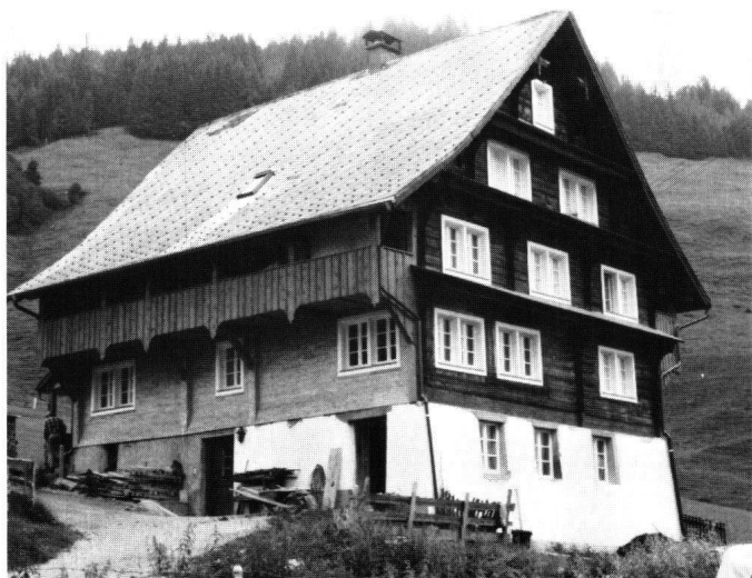
Abbildung 24 Unteriberg, Bauernhaus Meierhöfli. Die Hautfront nach der Restaurierung.

Das Meierhöfli dürfte wegen seines recht steilen Daches bereits ursprünglich mit Tonziegeln gedeckt gewesen sein.