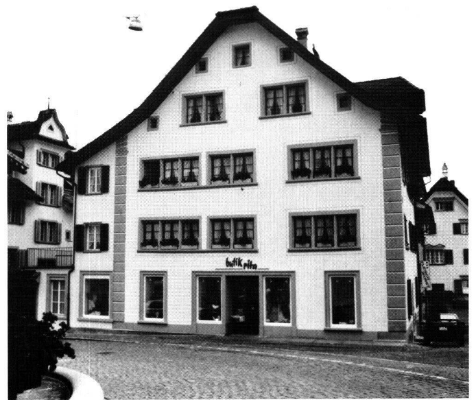
Abbildung 6 Schwyz, Haus Gürber, ehemals Apotheke Triner. Hauptfront nach der Restaurierung mit rekonstruierter Eckquaderbemalung.

Das Bürgerhaus Herrengasse 3 gehört zum Baubestand, der nach dem Dorfbrand von 1642 entstand. Prominent ist seine Lage unmittelbar neben der Pfarrkirche; auf diese ist es auch ausgerichtet.