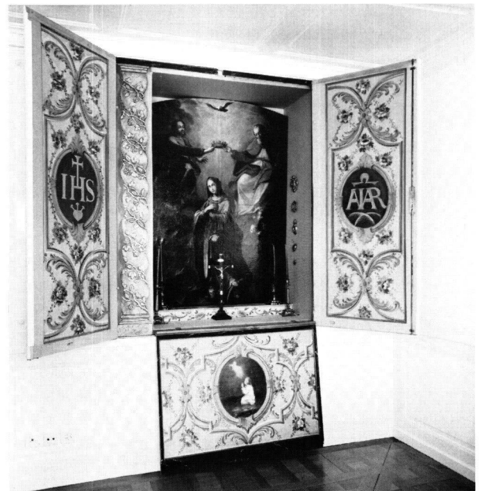
Abbildung 2 Schwyz, Reding-Haus an der Schmiedgasse. Der herausgeklappte Hausaltar im Südostzimmer.

Im Verlauf des 19. Jahrhunderts war das ganze Gebäude sukzessive restauriert resp. neu gestaltet worden. Zu diesen Massnahmen gehörte auch die Sanierung der Hauptwohnung im ersten Obergeschoss unter der Leitung von Architekt Stehlin. Es scheint, dass bei diesen Arbeiten die Zimmereinteilung nicht verändert wurde. Auch der Gang, der sich um den Innenhof zieht, blieb in seinem ganzen Umfang erhalten. Wie weit dabei barocke Stukkaturen in diesem Bereich erhalten blieben oder wie weit jene mit Rocailles bereichert wurden, liess sich trotz Bauuntersuchung nicht abklären. Zu vermuten ist, dass die Deckenspiegel zum alten Bestand gehören, ornamentale Teile jedoch in den Jahren 1891-1907 hinzugefügt wurden. Jedenfalls liessen sich für Stäbe und Rocailles unterschiedliche Stuckmassen unterscheiden. Der Gang besitzt heute wieder