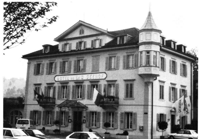
Abbildung 40 Küssnacht, Seehof. Die Hauptfront nach der Restaurierung.

Der Seeplatz von Küssnacht wird durch die Westfront der Pfarrkirche und die grossen Bauten des Pfarrhauses und der Rathäuser I und II sowie durch das Hotel Seehof dominiert. Der klassizistische Bau ist streng auf den Platz ausge-