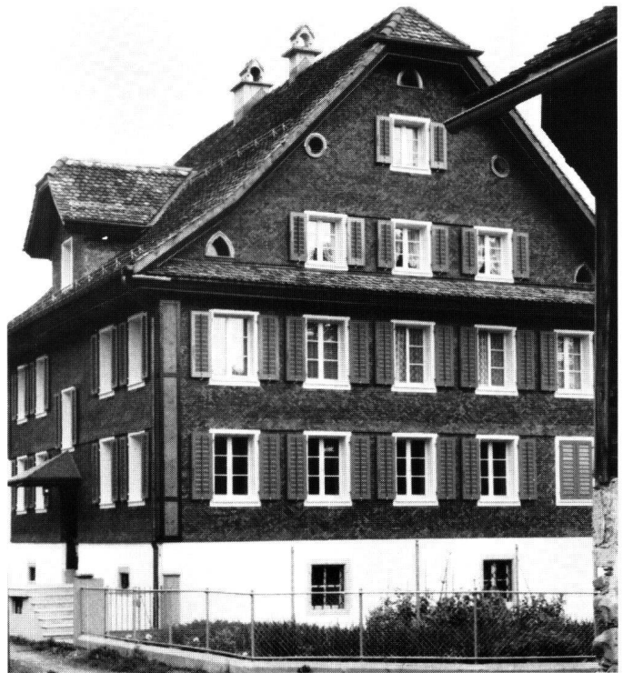
Abbildung 14 Arth, Haus Ehrli. Hauptfront nach der Restaurierung.

An die markante seeseitige Massivmauer schliesst ein Strickbau an. Dieser ist vollständig verschindelt. Das Strickwerk zeigt kaum Abnutzungsspuren, so dass angenommen werden muss, dass der Schindelmantel von Anfang an existierte. Die Dach- und Klebedachuntersichten sind kassettiert. Die Befensterung ist grosszügig und symmetrisch angeordnet. Die Fenster im gemauerten Teil besitzen Traubengitter, diejenigen am Holzteil sind mit Jalousieläden mit beweglichen Brittchen versehen.