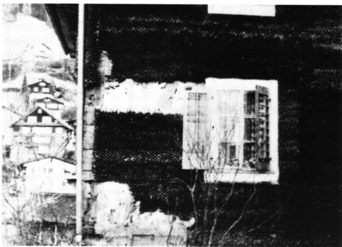
Abbildung 27 Morschach, Pfarrhaus. Ausschnitt von der Rückfront mit teilweise freigelegter Fachwerkkonstruktion unter dem jüngeren Schindelmantel.