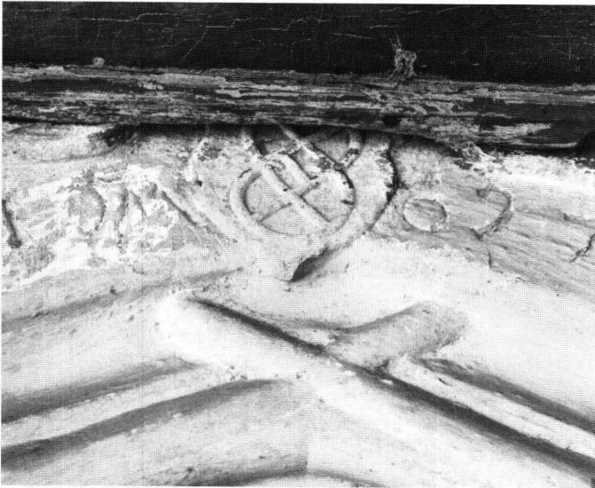
Abbildung 32 Galgenen, Haus in der Kürzi. Das Portal zum Saal mit dem Datum 1597.

wicklung und somit seine Geschichte ist aber am Objekt erhalten und ablesbar geblieben, so dass es durchaus gerechtfertigt ist, den Zustand des 19. Jahrhunderts als Richtlinie beizubehalten. Eine Rückführung wäre an sich denkbar, jedoch mit dem Risiko verbunden, am Schluss ein verstümmeltes Objekt zu haben. Zahlreiche Details liessen sich kaum mehr feststellen. Schon die Rekonstruktion der Fensterform ergäbe Schwierigkeiten.