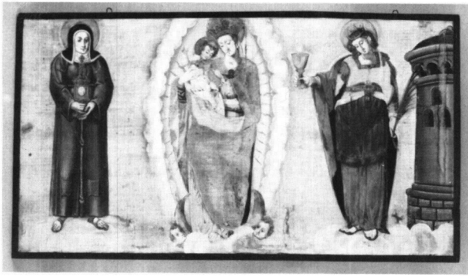
Abbildung 20 Muotathal, Klosterkirche St. Joseph. Antependium der ursprünglichen Mensen, eine Tüchleinmalerei, fand als Antependium des neuen Zelebrationsaltares Verwendung.

sich weitere Reste der Ausmalung des Kirchenraumes durch Bertle. Die ornamentale, teils auch figürliche Ausmalung wurde zwar dokumentiert und gesichert, aber überkalkt.