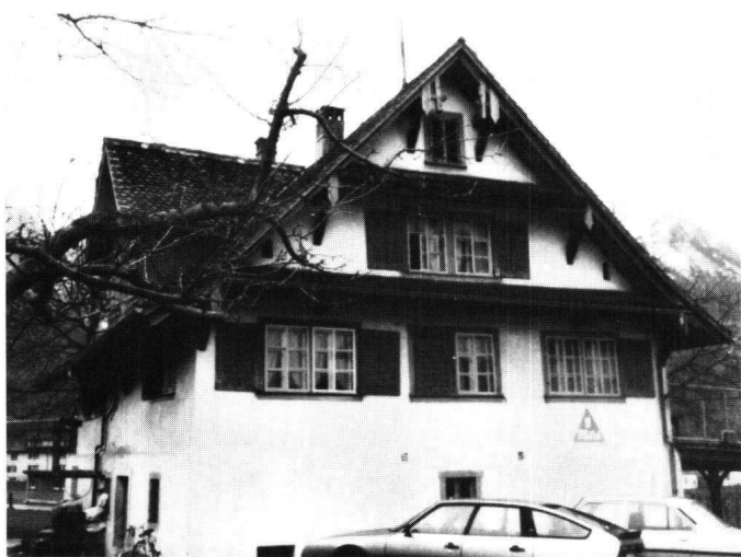
Abbildung 9 und 10 Schwyz, Ibach, Ökonomiegebäude Hof. Vor und nach der Restaurierung.

Vor einigen Jahren wurde das herrschaftliche Wohnhaus «Hof» in Ibach restauriert. Im Kern verbirgt sich ein Gebäude aus dem 16. Jahrhundert, das im 19. Jahrhundert auf die heutige Form im Stil des Biedermeier gebracht wurde. Neben dem Herrenhaus steht ein langgezogener Ökonomietrakt. Bereits erste Sondierungen haben gezeigt, dass es sich um ein Gebäude des späten 17. oder frühen 18. Jahrhunderts handeln muss. Am ehesten ist dies an der Form der feingeschweiften Büge der Klebdächer zu erkennen. Auch liess sich durch den Putz des 19. Jahrhunderts