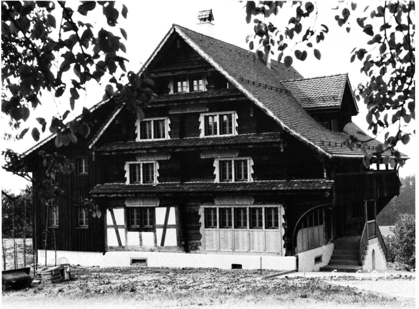
Abbildung 42 Feusisberg, ehemaliges Bürgerheim. Die Rückfront mit den anhand des Befundes rekonstruierten Ziehläden mit Seitenbärten.

Das ganze Gebäude wurde im Erscheinungsbild sowie in der Raumstruktur des frühen 18. Jahrhunderts belassen. Leider mussten die Täferungen wegen ihres schlechten Erhaltungszustandes zu einem grossen Teil ersetzt werden. Hingegen konnten die beiden Kachelöfen wieder eingebaut werden.