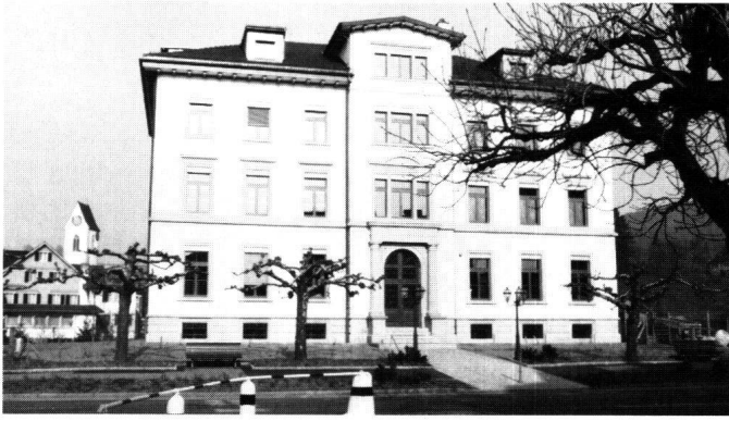
Abbildung 34 Wangen, Schulhaus. Die Hauptfront nach der Restaurierung.