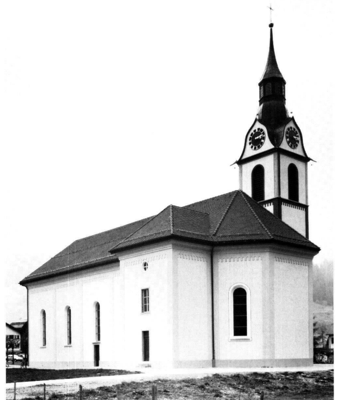
Abbildung 23 Unteriberg, Pfarrkirche St. Joseph. Die wiederhergestellte Gliederung an Fassaden und Turm.