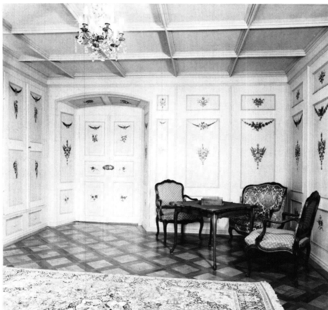
Abbildung 3 Schwyz, Reding-Haus an der Schmiedgasse. Mittelzimmer mit freigelegter Täferbemalung des 18. Jahrhunderts.

seine alten Ausmasse, wurde doch eine jüngere im Südarml hinzugefügte Trennwand entfernt und der Deckenstuck ergänzt. Im gleichen Zuge wurden auch die kopflastigen Wohnungseingänge transparenter gestaltet.