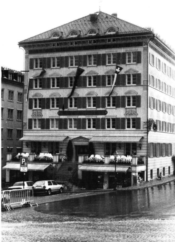
Abbildung 39 Einsiedeln, Pfauen. Die Hauptfront mit rekonstruierter Fassadenmalerei.

Richtung heftigen Gesprächsstoff. Sollte auf eine Erhaltung des bestehenden Gebäudes gedrängt, ein moderner Neubau auf den Klosterplatz von Einsiedeln gestellt oder eine Rekonstruktion des Gebäudes des 19. Jahrhunderts in Betracht gezogen werden?