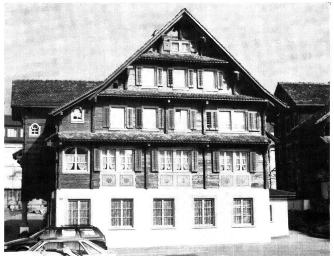
Abbildung 21 Steinen, Gemeindehaus. Hauptfront mit der wiederhergestellten Bemalung der Ziehläden.

Das Gemeindehaus besitzt im gut erhaltenen Dorfgefüge von Steinen, insbesondere am Postplatz, einen wichtigen Stellenwert. Bedeutungsvoll ist auch seine Nachbarschaft zum vor einigen Jahren restaurierten Pfarrhaus (siehe MHVS 78/1986).