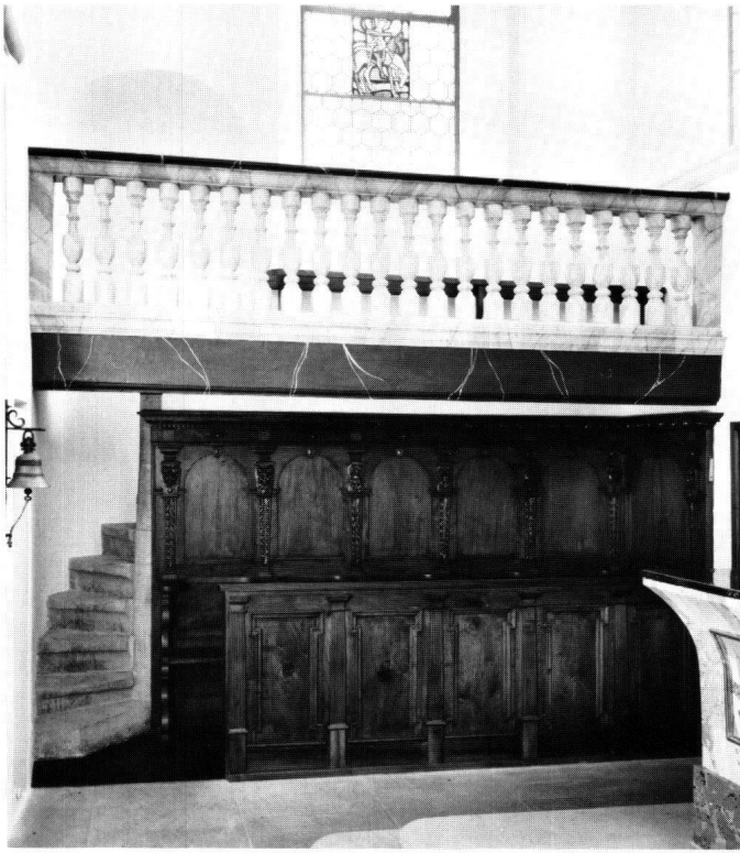
Abbildung 16 Ingenbohl, Dorfkapelle Brunnen. Blick auf die wiederhergestellte Chorempore.

stung wurden in die vorhandenen Löcher der Tragkonstruktion Baluster eingesetzt.