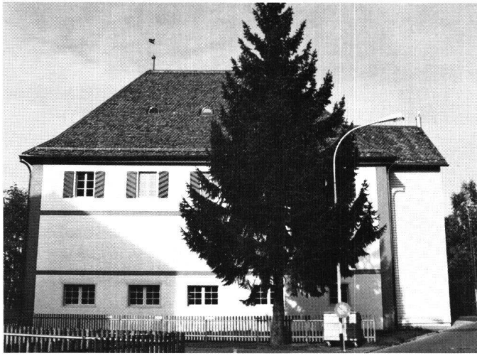
Abbildung 36 Einsiedeln, Chärnehus. Das Äussere nach der Restaurierung mit der wiederhergestellten Fassadenbemalung.

sive Steinbauten waren in unserer Holzbauregion nur besonderen öffentlichen Gebäuden vorbehalten.