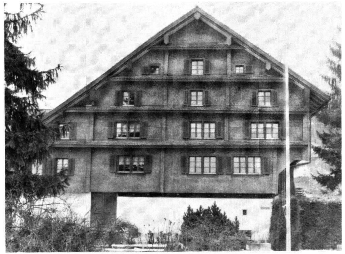
Abbildung 7 Schwyz, Ibach, Haus Gerbihof. Hauptfront nach der Restaurierung im Zustand des 19. Jahrhunderts.

Die Restaurierung beschränkte sich im wesentlichen auf die Pflege der überlieferten Substanz. Zutat sind die aufgemalten Eckquader, deren Vorbilder in Bildquellen gefunden werden konnten. Der barocke Anbau setzt sich optisch durch die erwähnte Quaderbemalung und einen leicht differenzierten Anstrich vom Hauptbau ab. Das Gebäude stellt somit ein wichtiges Zeugnis aus der Bautätigkeit nach dem Dorfbrand von Schwyz dar und vertritt einen sonst nicht mehr existierenden Typ.