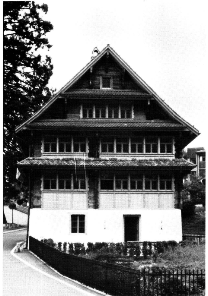
Abbildung 26 Morschach, Pfarrhaus. Die Hauptfront mit der wiederhergestellten alten Fenstereinteilung und den Ziehladenverkleidungen.

Die Gesamterscheinung des Hauses mit seiner sichtbaren Holzkonstruktion und der traditionellen Dachform ist