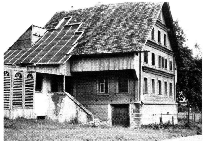
Abbildung 31 Galgenen, Haus in der Kürzi. Gesamtansicht.

Das Gesicht des Hauptbaues hat sich zwar im 18. Jahrhundert (zu diesem Zeitpunkt wurden vermutlich die gotischen Fensterreihen zu Gunsten einer moderneren Befensterung aufgegeben) und im 19. Jahrhundert mit der Verschindelung des Hauses verändert. Die ganze bauliche Ent-