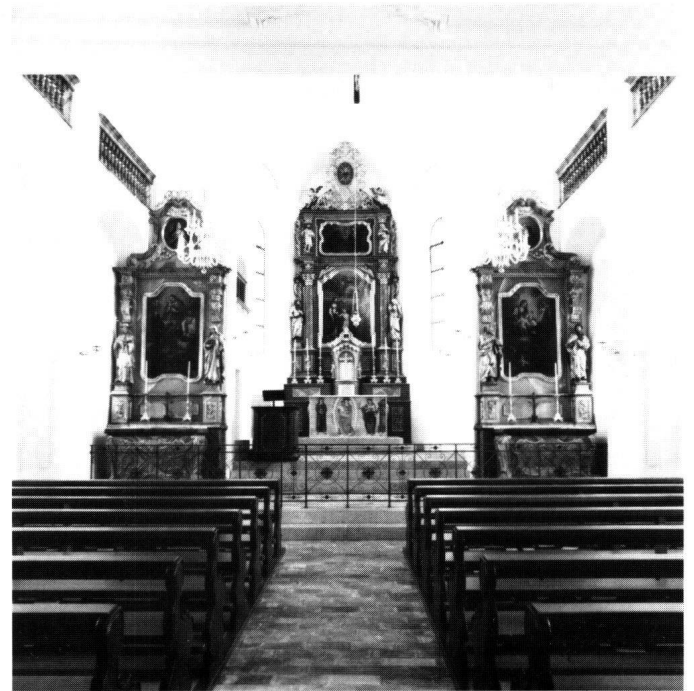
Abbildung 19 Muotathal, Klosterkirche St. Joseph. Blick gegen den Chor; im Vordergrund die auf die alte Tiefe zurückversetzte Schwesternempore.

Im Innern richteten sich die Massnahmen vor allem auf die Konservierung der erhaltenen Substanz. Die Bienenwabenverglasung, die zum Teil in den oberen Fensterreihen noch existierte, wurde im ganzen Raum ergänzt. Der Decken- und Wandstuck des 17., 18. und 19. Jahrhunderts wurde gereinigt und frisch gekalkt, die Deckenbilder, von Josef Bertle in Öl-Tempera-Technik ausgeführt, gereinigt und die Fehlstellen retouchiert. Beim Bauuntersuch fanden