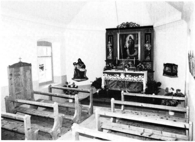
Abbildung 30 Illgau, Herz-Jesu-Kapelle im Hinteren Oberberg. Das Innere mit dem spätklassizistischen Altar mit dem Bild von Melchior von Deschwanden.

goldungen mussten neu angeschossen werden. Die grosse, geschnitzte Pietà des 19. Jahrhunderts wurde verfestigt und die Fassung restauriert. Originell sind die Kreuzwegstationen, Kupferstiche in einfachen Louis-XVI-Rähmchen. Woher sie stammen, ist nicht bekannt. Sicher sind sie aber wesentlich älter als die Kapelle, wie auch die gefasste, kleine Barock-Madonna, die heute über dem Eingang montiert ist, und das Wachs-Christuskind in schönem Holzgehäuse mit Einlegearbeiten im Chorbereich. Die bestehenden, einfachen Tannenbänke und der aus der Wand herausklappbare Beichtstuhl wurden restauriert und wieder montiert.