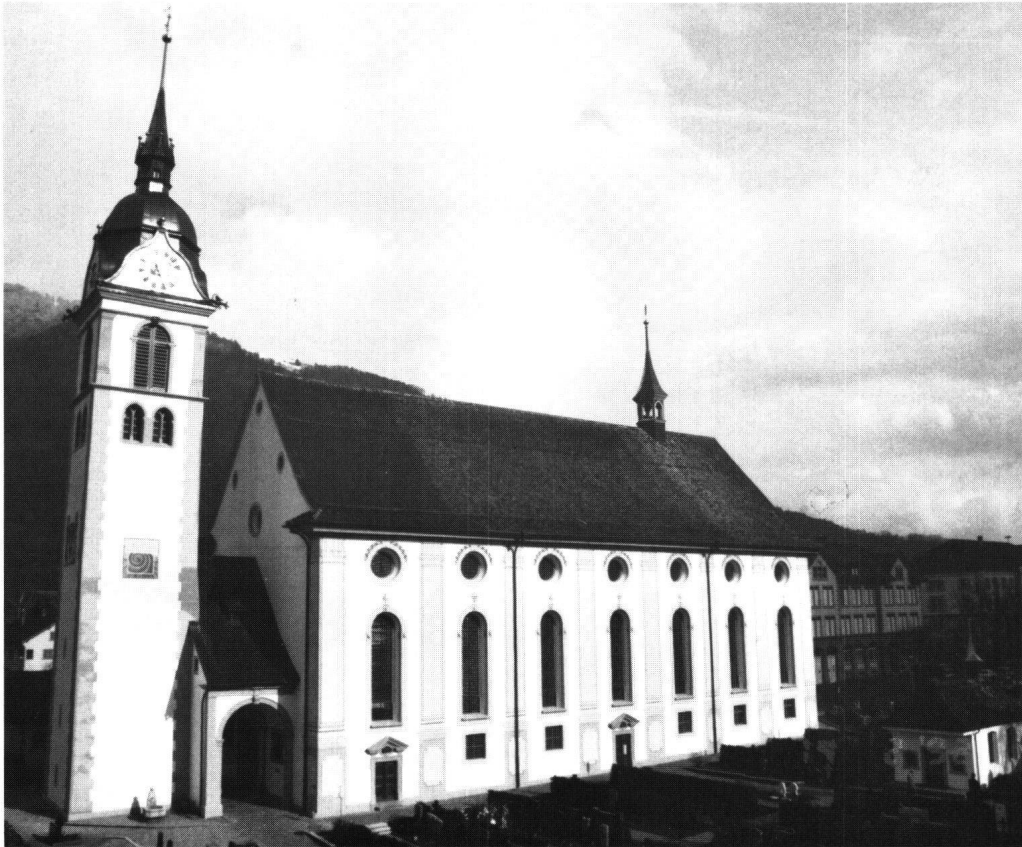
Abbildung 13 Arth, Pfarrkirche St. Georg und Zeno. Nach der Rekonstruktion der Fassadenmalerei.

Zusätzlich fand sich eine stark verblasste Photo von unbekannter Hand, die den unteren Teil des Turms während Ausbesserungsarbeiten zeigt. Zu vermuten ist, dass die Aufnahme nach 1896 entstand. Vorher war das Innere vollumfänglich nach den Empfehlungen von Pater Albert Kuhn aus Einsiedeln überholt worden. Es scheint, dass in der Folge auch das Äussere renoviert wurde. Die üppigen Lisenen, die die Aufnahme Bettschart noch zeigt, wurden in vereinfachter Form neugemalt. Glücklicherweise ist auf dieser Aufnahme die malerische Gestaltung des Turmes besser ablesbar als auf der Aufnahme Bettschart . Anhand dieser Bilddokumente und des Farbbefundes am Profil des Dachfusses konnte die Dekorationsmalerei planerisch erfasst werden. Dieses Projekt wurde dem Bürger zur Genehmigung vorgelegt.