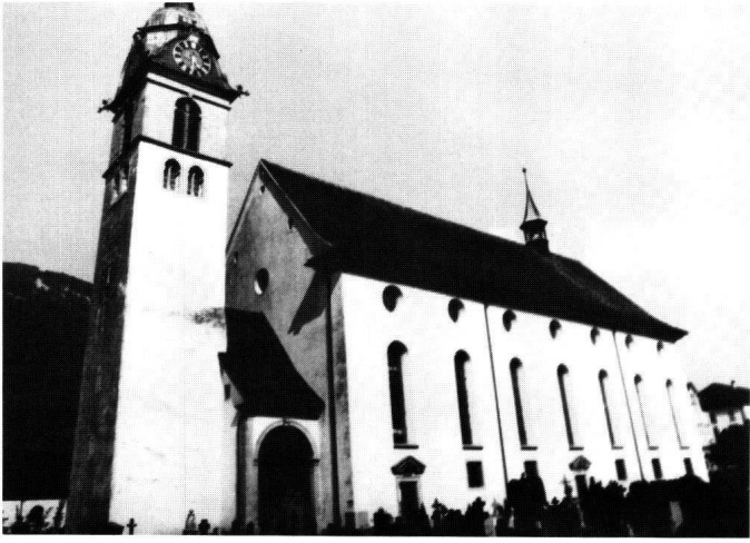
Abbildung 11 Arth, Pfarrkirche St. Georg und Zeno. Vor der Rekonstruktion der Fassadenmalerei.

abschlüsse von Ober- und Unteriberg aus dem späten 19. Jahrhundert.