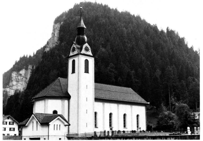
Abbildung 22 Unteriberg, Pfarrkirche St. Joseph. Choransicht, in den 60er-Jahren wurden die aufgemörtelten Fassadengliederungen und die reich profilierte Dachuntersicht entfernt.

Die Pfarrkirche St. Joseph in Unteriberg zeigt zwei Stiltendenzen auf. Einerseits entsprechen die Grundmasse, die technische und architektonische Grundgestaltung noch kirchlichen Bauten des 18. Jahrhunderts. Insbesondere der Turm wird formal bestehenden Barocktürmen angepasst. Andererseits entspricht die Detailausbildung modernen