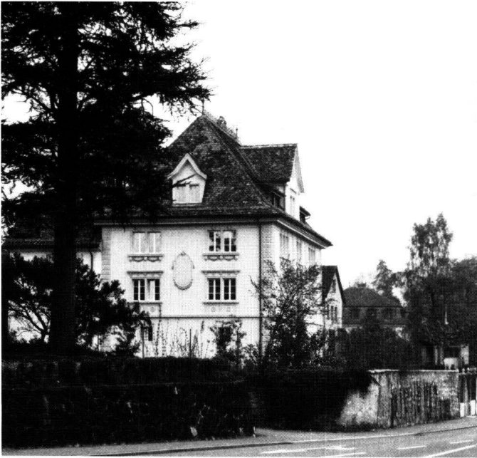
Abbildung 5 Schwyz, Herrenhaus Kappelmann an der Herrengasse. Nach der Restaurierung der Stuckfassade des 19. Jahrhunderts.

wurden, auch das Walmdach gehört dieser Epoche an. In einem der beiden Anbauten wurde eine gutausgestattete Hauskapelle eingerichtet. Eine Federzeichnung, entstanden um 1800, zeigt uns diesen Zustand. Auch das Innere wurde, mit Ausnahme des Treppenhauses, vollständig neu ausgestattet. Teilweise wurde die Raumdisposition verändert. Etliche Räume erhielten gutproportionierte Decken mit Quadraturstuck, andere wurden mit gestrichenen Holztäfern ausgestattet. Teilweise waren auf diesen auch ornamentale Bemalungen vorhanden, die aber nur noch in Bruchstücken erfasst werden konnten.