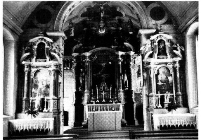
Abbildung 17 Ingenbohl, Kapelle St. Wendelin, Unterschönenbuch. Das reich ausgestattete Innere mit den drei Barockaltären und der Ausmalung von J. Bertle.

Aus den Akten des Kapellarchivs konnte der Zustand des Raumes zur Zeit der Umgestaltung durch Bertle in Erfahrung gebracht werden. Damals besaßen die Fenster