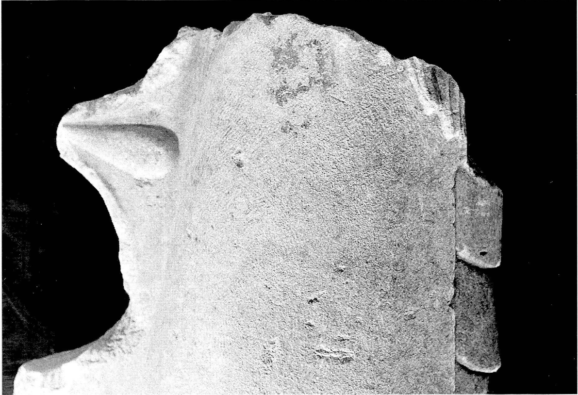
Abb. 4. Marmorfragment eines Meerwesens von Magoula. Museum Eretria, Inv.Nr. 17767, Photo Verf.