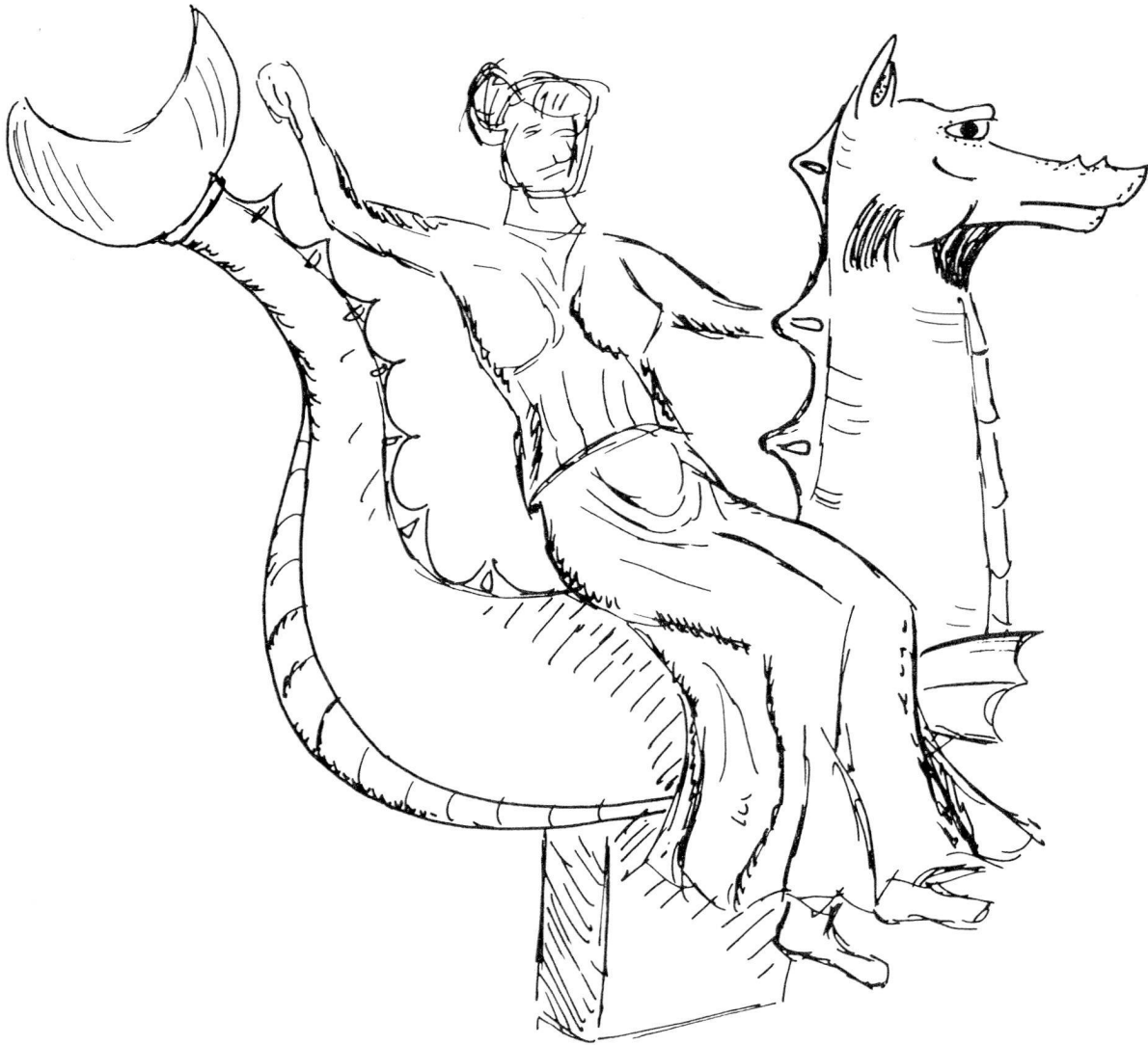
Textabb. 2. Rekonstruktionszeichnung der Skulptur Abb. 1–4, Zeichnung Verf.

haben muss 54 . Da sich die Friedhöfe der Antike zumindest ab der klassischen Zeit ganz generell entlang der Ausfallstrassen der Siedlungen aufreihen 55 , ist davon auszugehen, dass auch das Ketos-Monument einst in der Nähe eines Strassenverlaufes stand, um den Vorbeigehenden vom Reichtum und Ruhm des Verstorbenen und seiner Familie Zeugnis abzulegen.