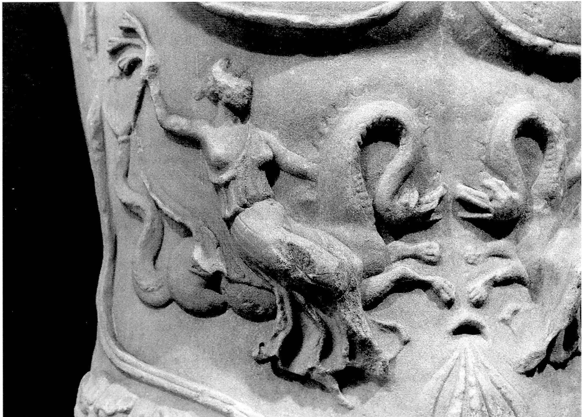
Abb. 5. Ausschnitt vom Brustpanzer einer Kaiser(?)statue aus Megara, frühes 2. Jh. n.Chr. Athen, Archäologisches Nationalmuseum, Inv.Nr. 1644