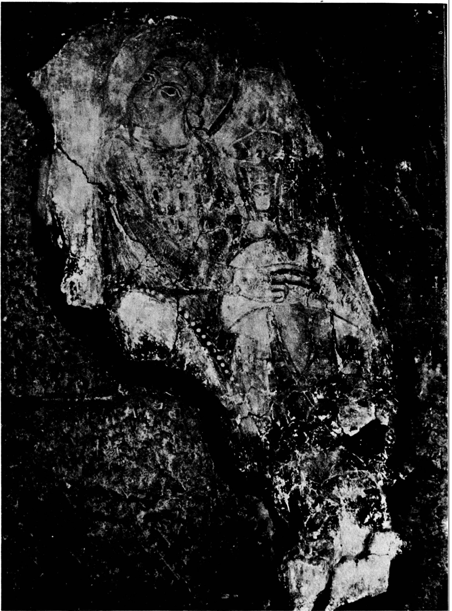
Planche 12. Rome, temple dit de la Fortune virile, Jean écrivain (d'après Lafontaine).