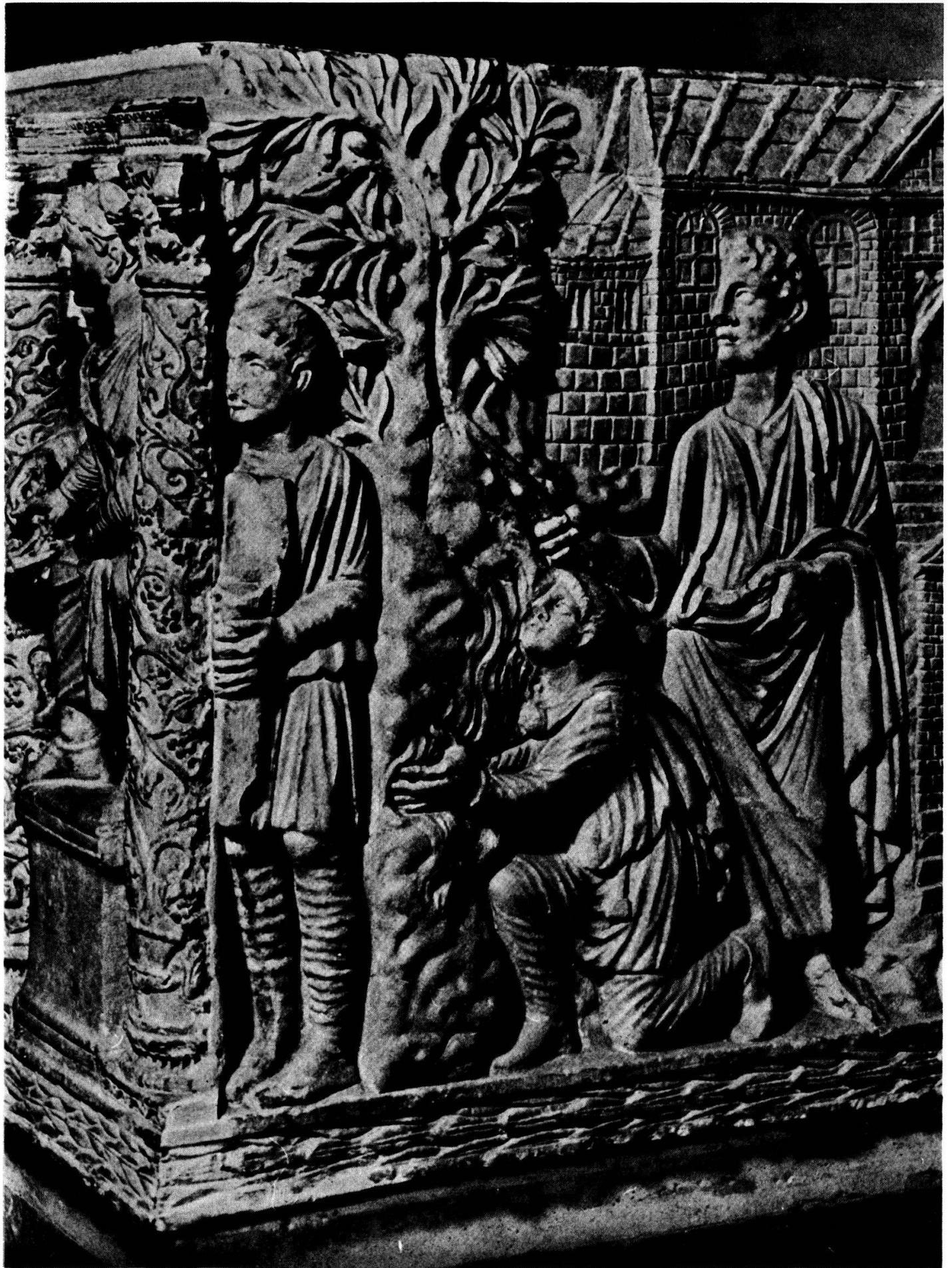
Planche 10. Rome, Vatican, Museo Pio Cristiano, face latérale droite du sarcophage 174 (d'après Volbach).