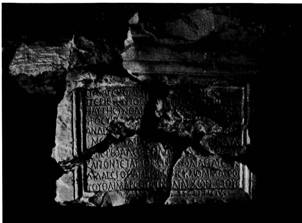
Fig. 2. Face latérale gauche.