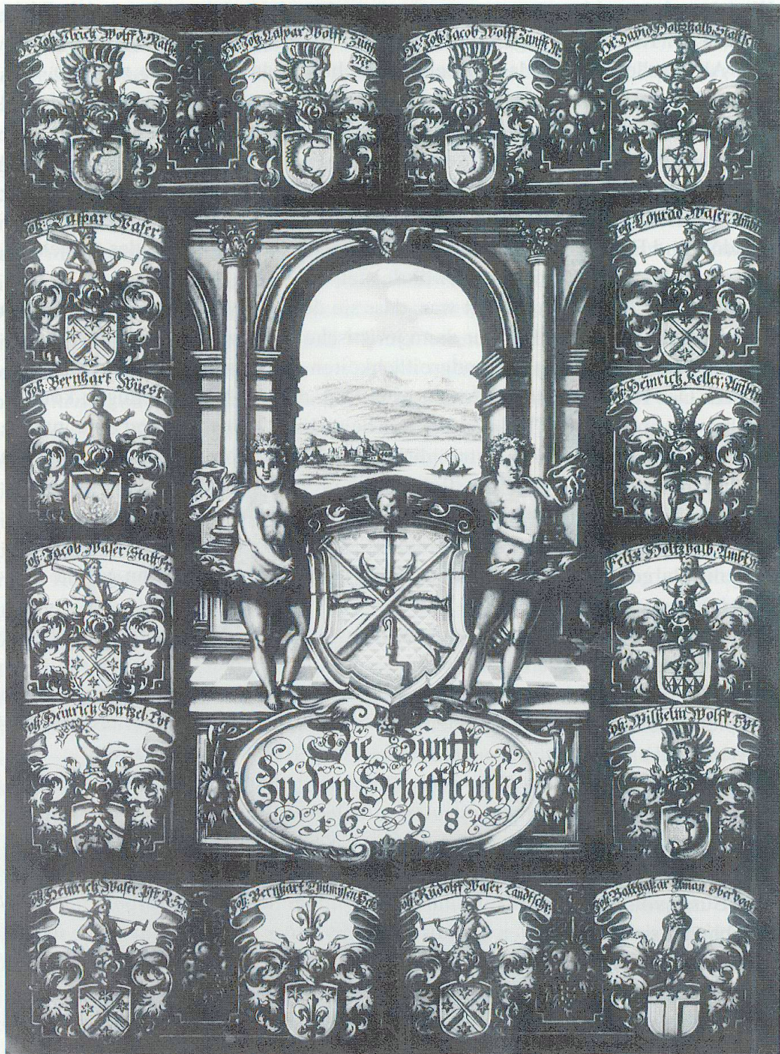
Abb. 74. Wappenscheibe der Zunft zur Schiffleuten 1698.