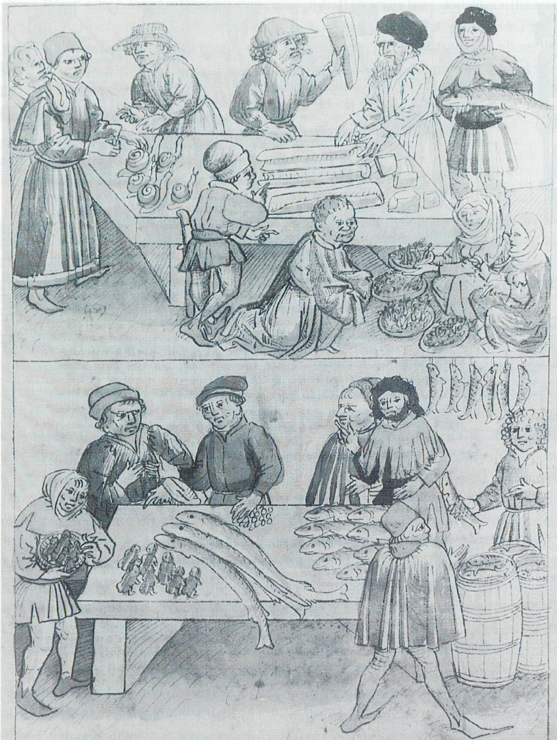
Abb. 63 (linke Seite) und 64. Reges Treiben auf dem Fischmarkt. Das Angebot war wohl nicht immer so üppig wie hier während des Konzils in Konstanz.