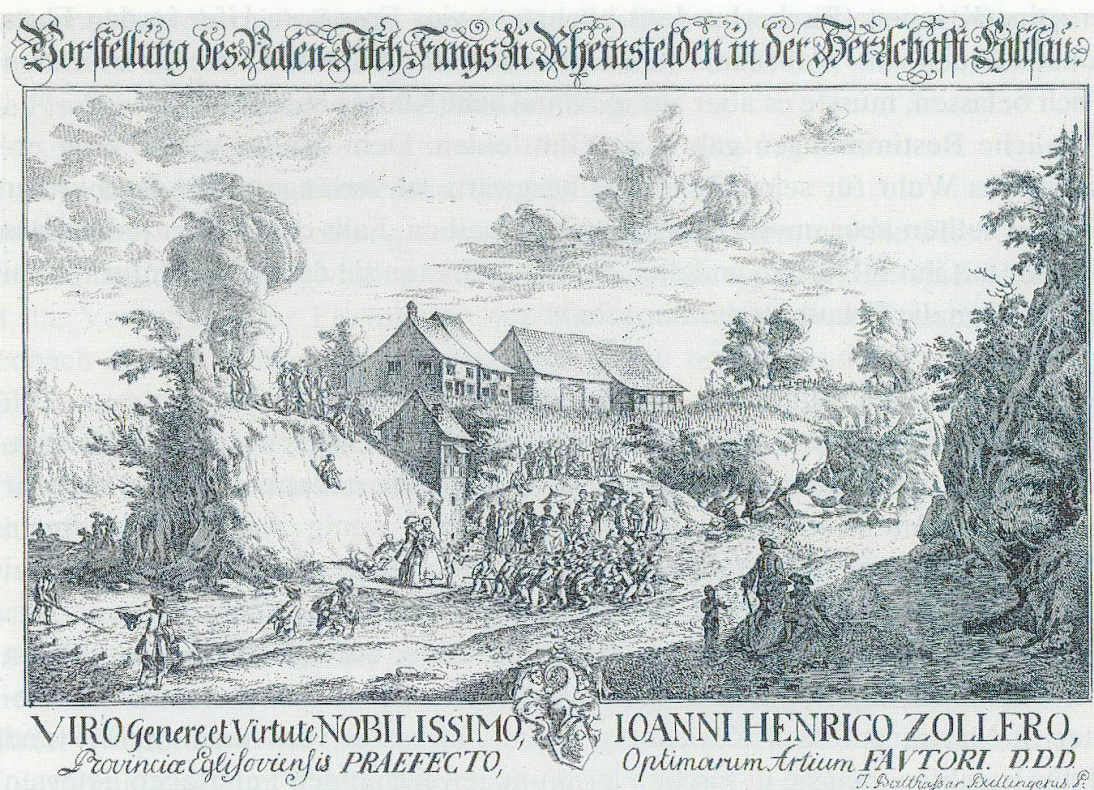
Abb. 67. Der Nasenfang in der Glatt bei Rheinsfelden zur Zeit der Fischwanderung war jeweils ein grosses Ereignis. Die Gehilfen, einer dicht neben dem andern, wateten in zwei Reihen flussaufwärts und fischten mit grossen Schiebebären die Nasen aus dem Wasser. Für die Fische gab es kein Entkommen, da ihnen mit einem quer zum Fluss gebauten Wehr der Weg versperrt wurde. In der linken Bildhälfte ein junger Mann mit einem Flossschiff.

luden jeweils die Priester von Uster ein zum gemeinsamen Fangen von Fischen und Krebsen im Usterbach 104 .