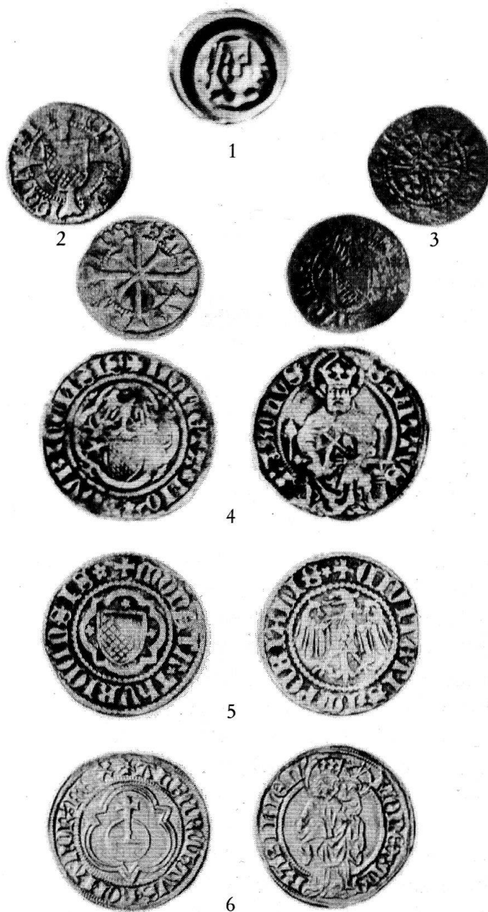
1. Abtei/Stadt Zürich, Angster, 15. Jahrhundert. – 2. Stadt Zürich, Kreuzer, Mitte 15. Jahrhundert. – 3. Stadt Zürich, Fünfer, um 1480. – 4. Stadt Zürich, Plappart, um 1420/30. – 5. Stadt Zürich, «Krähenplappart», um 1440/50. – 6. Reichsmünzstätte Basel, Goldgulden des Königs Albrecht II., 1438/39. – Alle Stücke in natürlicher Grösse reproduziert. – Phot.: Schweiz. Landesmuseum, Zürich

Sonderdruck aus den Jahresberichten 1984 und 1985 der Ritterhaus-Vereinigung Uerikon-Stäfa. Stäfa 1986, 2+27 Seiten.