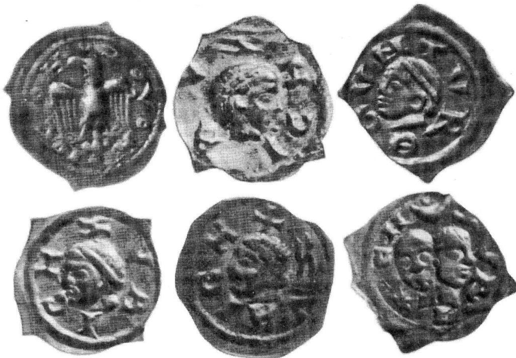
Zürcher Pfennige, 12./13 Jahrhundert, vergrößert (2:1) Aufnahmen: Schweiz. Landesmuseum, Zürich