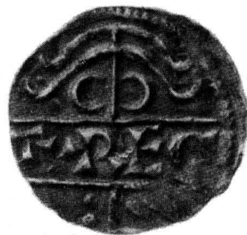
Denar Kaiser Ottos I. (Vorder- und Rückseite, 2:1)