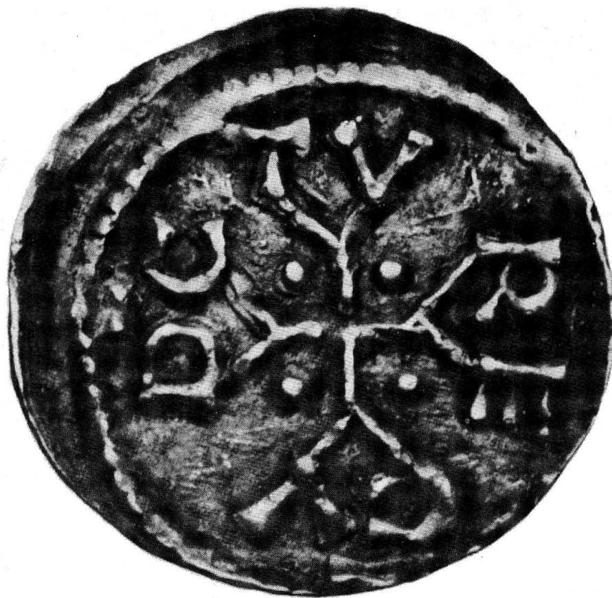
Denar Herzog Hermanns I. (stark vergrößert)