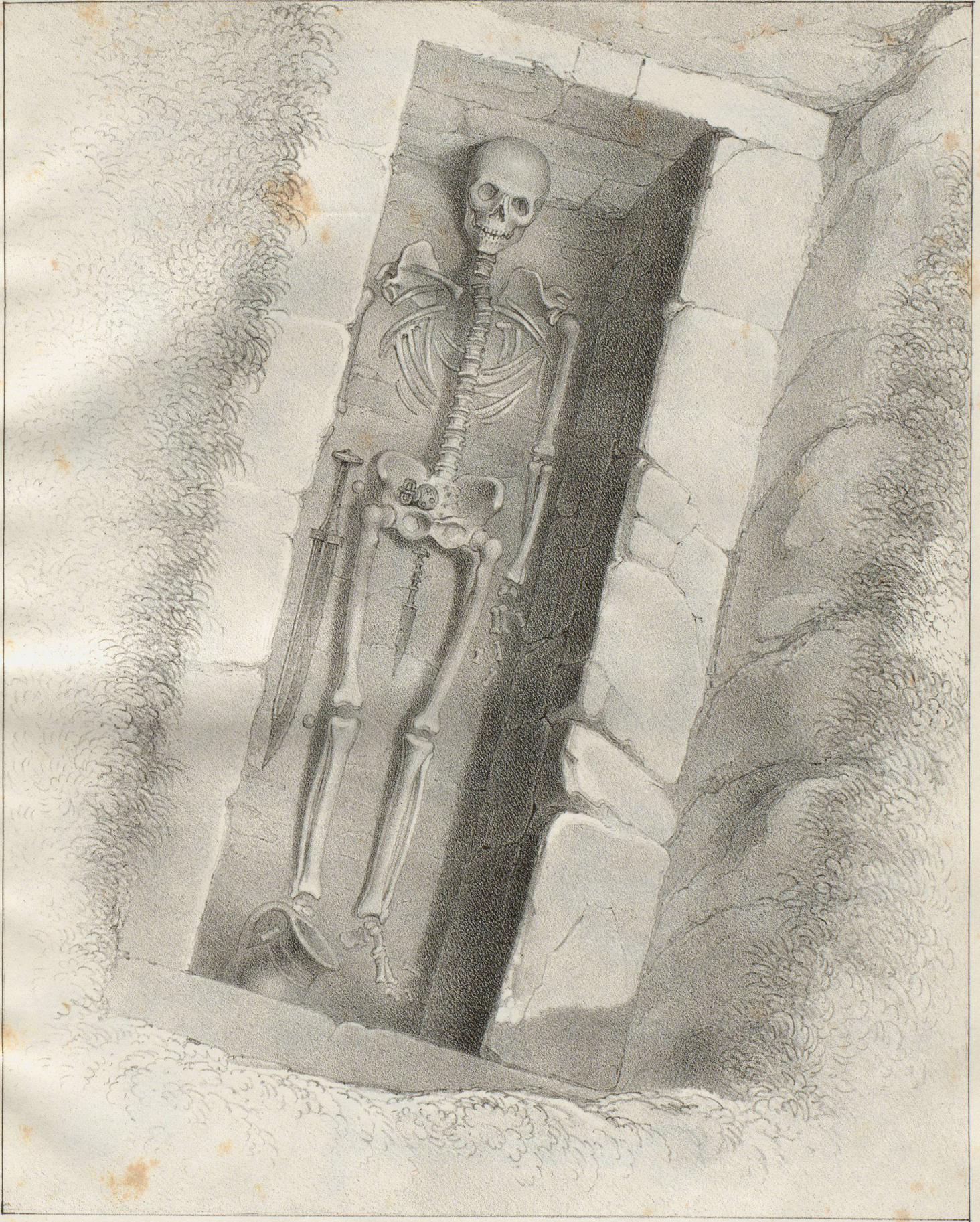
Sarcophage du cimetière de 'Bel-Oir.