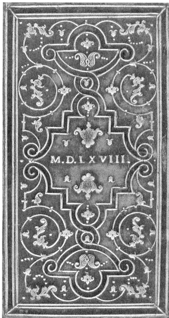
Reliure «à la Grolier» de 1568, avec mosaïque de cuir: les filets sombres ont été imbriqués dans le cuir clair.

Il est évident que, d'un point de vue scientifique, c'est le seul contenu de ces ouvrages qui importe pour le chercheur. Mais le bibliophile est ravi, au cours de la visite des lieux, de pouvoir admirer les enluminures du Codex Guta-Sintram , les initiales