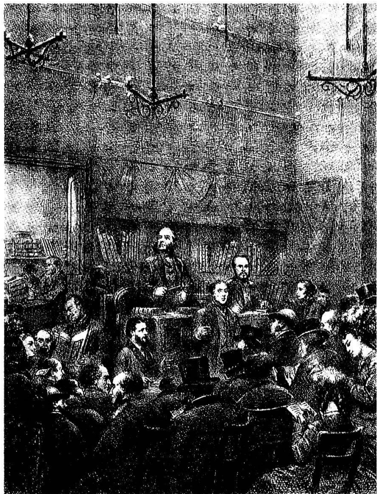
Bücherversteigerung im Hôtel Drouot, Paris, um 1870.