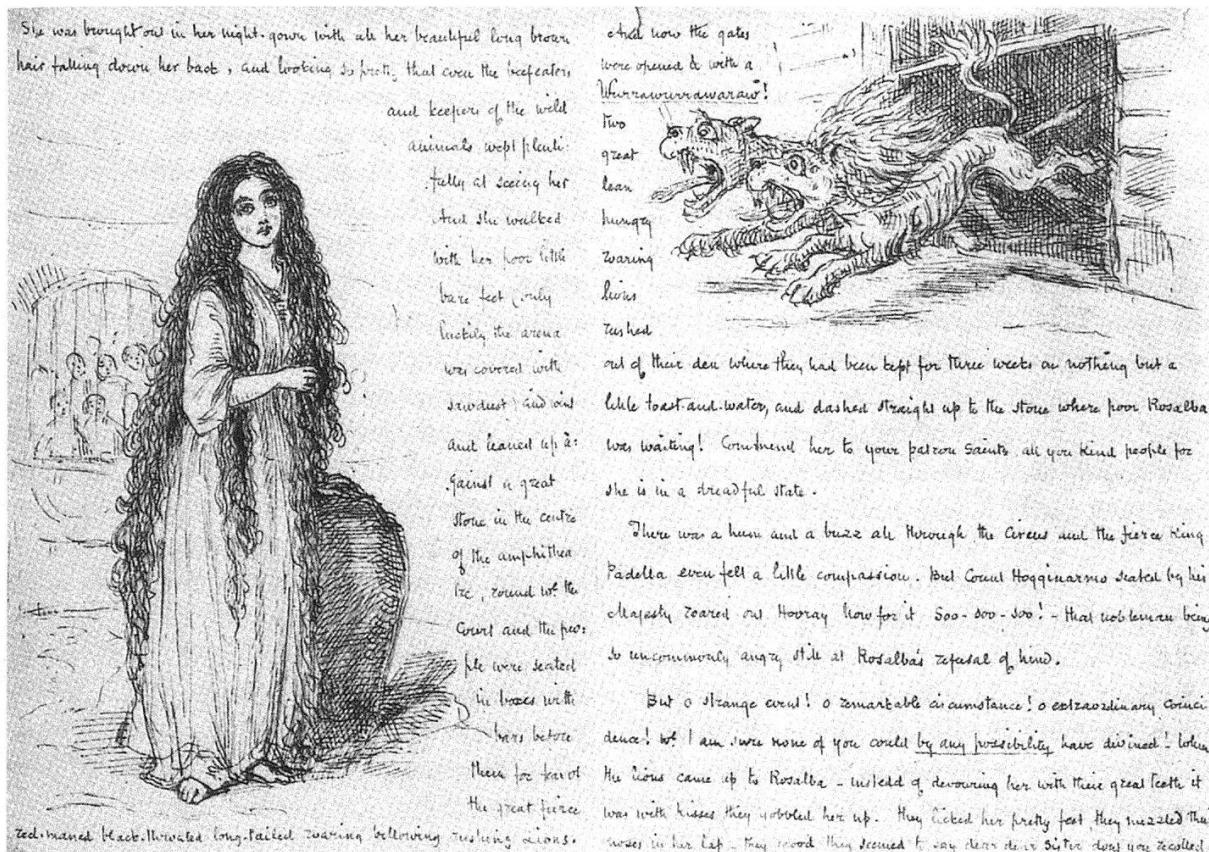
William Thackeray, Manuskriptblatt aus «The Rose and the Ring» (1853). 139 × 219 mm. New York, Pierpont Morgan Library (MA 926).