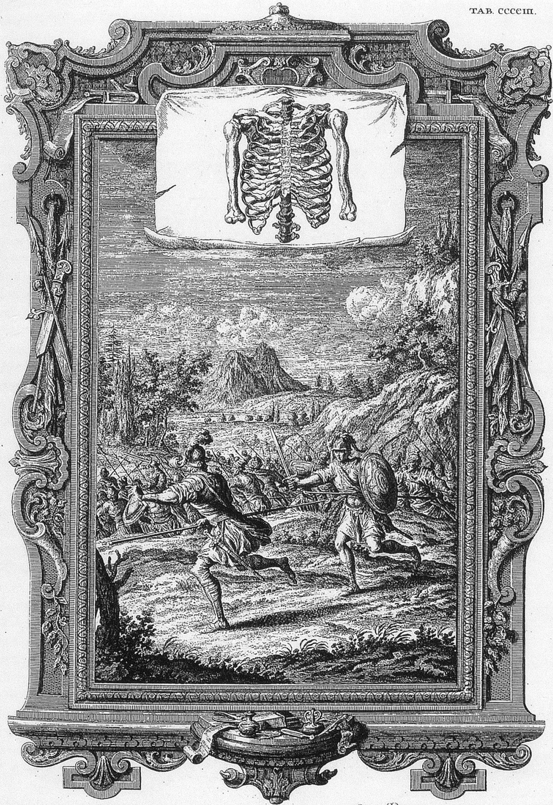
II. SAM. Cap. II. v. 23. Achelis Vulnus lethale.