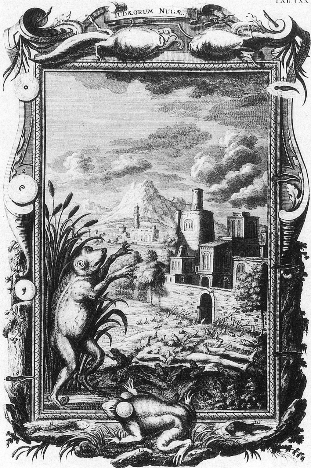
EXODI Cap VIII v 2-14 Ranarum Forma et Metamorphosis