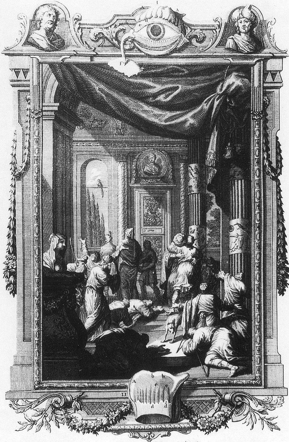
GENESIS Cap. XLIII. v. 29. Cap. XLV. v. 2. 3. 14. 15. Iosephus fratribus manifestatus.