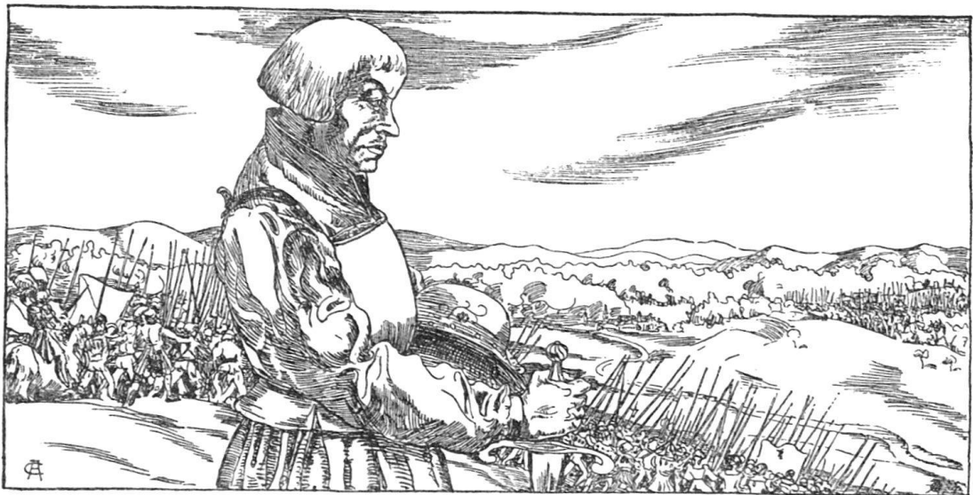
Cuno Amiet (1901). Zwingli bei Kappel.