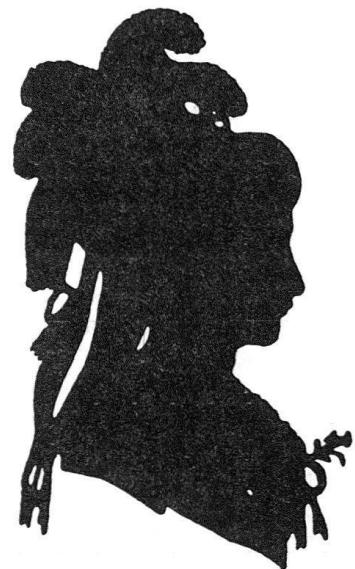
Abbildung zu Katalognummer 12.