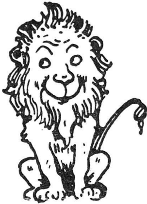
Abbildung zu Katalognummer 27.

Aufgaben und Ziele der Bibliophilie austauschten, bescheiden das stolze Confiteor sprach: er habe seit seiner Schulzeit kein einziges Buch gelesen! Er wußte, daß sich in der Beschränkung erst der