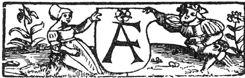
Abb. 1. Druck von Amandus Farckall in Hagenau 1525.

Bisch-//weyler [schwarz] beschreibenn... [Leiste]. (Am Ende:) Gedruckt zu Haganaw durch Amandum farckal //