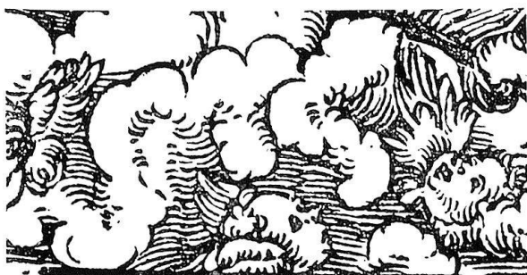
Abb. 1. Petrarcomeister, Detail des Holzschritts M. 371