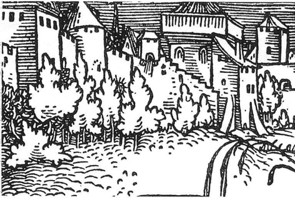
Abb. 13. Petrarcomeister, Detail des Holzschnitts M. 215 aus Petrarcas Trostspiegel, 1532

stellt» (M. 275) vergleichen kann. Die angedeuteten Palmenwipfel, die Palmettenbäumchen mit den gleichsam «festonierten» Umrißlinien, die Gewanddrapierung mit dem langen, am Boden schleifenden Mantelende, das alles spricht die Formensprache des Petrarcomeisters. Die Art der Aufteilung des Baumstumpfes mit dem in der aufgeplatzten Rinde erscheinenden Dreieck des Stammholzes (vgl. hierzu Brosamers Johannesholzschnitt, Gutenberg-Jahrbuch 1953, S. 85, Abb. 11), die senkrecht geführte Rundbogenlinie am rechten Stammrand, die Wurzeln, die in zwei Spitzen auslaufen sind ähnlich im Baumstumpf der Bartholomäusdarstellung zu verfolgen.