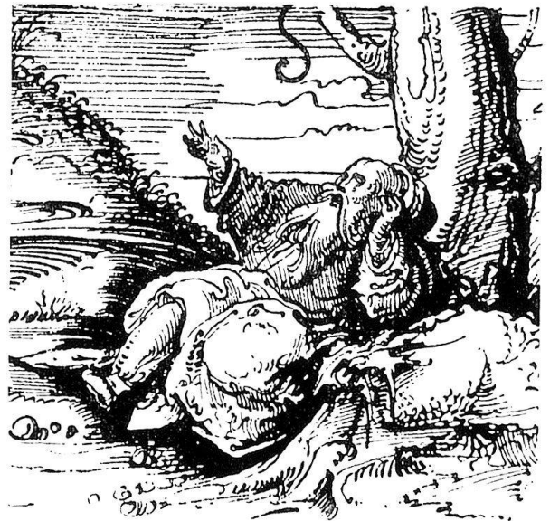
Abb. 16. Detail aus einer Burgkmair bzw. dem Petrarcomeister zugeschriebenen Randzeichnung des Maximilian-Gebetbuches von 1515

zunächst den Anschein hat, denn die Johannesaltarskizze ist der Angelpunkt einer ganzen Gruppe von Burgkmair zugewiesenen Zeichnungen. Wie weit sich diese Zuweisungen bei Herausnahme der Johanneskizze noch halten lassen, ob etwa die sämtlichen um sie gruppierten Blätter als Arbeiten des Petrarcomeisters anzusehen und damit, analog den Erkenntnissen auf dem Gebiet des Holzschnittes, auch Zeichnungen des Petrarcomeisters aus dem (Fuvre Burgkmairs herauszusondern sind, vermag ich nicht zu beurteilen. Sollte sich jedoch ein solches Resultat aus den vorliegenden Erwägungen ergeben, was zum Beispiel in Ansehung der Gebetbuchillustrationen des Petrarcomeisters für die beiden Zeichnungen zu einem Marienleben (abgebildet bei Schilling, Wallraff-Richartz-Jahrbuch 1933-34) nicht unwahrscheinlich anmutet, dann würde diese Erkenntnis möglicherweise eine weitere nach sich ziehen, nämlich die, daß für solche Blätter, die Entwürfe zu Altartafeln abgeben, auch die entsprechenden Gemälde, – also beispielsweise sowohl die im Louvre befindlichen Figurenzeichnungen der Innenflügel des Kreuzaltars, wie die Tafeln selbst – von dem Burgkmair-Gesellen, um den es hier geht, herrühren. Wie Burgkmairsche Holzschnitte in Rahmen des Petrarcomeisters gefaßt wurden (M. 584 und B. VII, 4-6), so mag das vom Meister selbst geschaffene Mittelbild des Kreuzaltars von Flügelbildern seines Gesellen, eben des Petrarcomeisters,