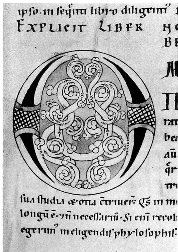
Abb. 1. Frowininitiale O mit Rankenwerk

Kaum zwanzig Jahre nach der Niederschrift des Originals schreibt man an diesem wahrlich damals noch abgelegeneren Orte die Werke Bernhards ab, die Werke, denn neben diesem ausge-