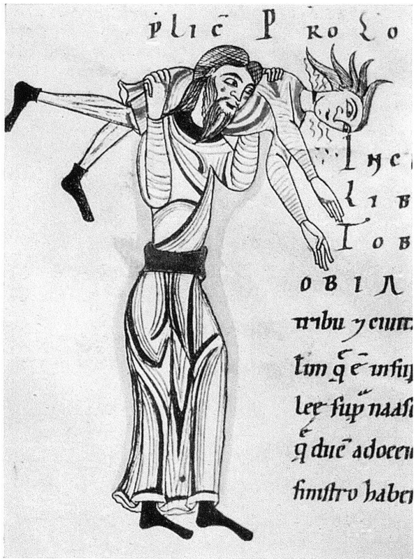
Abb. 3. Initiale T aus der Frowinbibel: Tobias, der einen Toten birgt

im Schwarzwald, hat er 1147 die Leitung des Hauses übernommen, das nach der Gründung durch den edlen Kurt von Sellenbüren und dem ersten Abte Adelhelm aus Muri eine traurige Periode überstehen mußte, weil Streitigkeiten, wahrscheinlich mit der Gründerfamilie, den Bestand des Klosters bedrohten. Mit Frowin zieht also eine neue Kraft in diesem Tale ein. Er selber ist nicht nur für die moderne theologische Literatur aufgeschlossen, er versucht sich auch in eigenen Arbeiten. In seinem Werke «De laude liberi arbitrii» gibt er eine Art Summa in der Form einer Sentenzensammlung. Die originelle Leistung besteht darin, daß er unter einem einzigen Gesichtspunkte die einzelnen Gebiete zu ordnen versteht. Selbstverständlich ist es dabei, daß der Mönch Frowin mehr der mystischen Richtung eines Bernhard und der Viktoriner folgt als den dialektischen Neuerungen eines Abaelard.