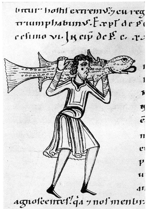
Abb. 2. Buchstabe T aus einer Frowinhandschrift: Ein Mann, einen Fisch tragend

stellten Bande birgt unsere Bibliothek aus der gleichen Zeit auch andere Schriften von ihm. Und Bernhard ist nicht der einzige zeitgenössische Schriftsteller, der in Engelberg Aufnahme gefunden hat. Auch Hugo und Richard und Achard von St. Viktor sind hier bekannt, man hat Anselm von Canterbury gelesen und abgeschrieben, und man hat auch schon Stellung genommen zu Petrus Abaelard, der zu Paris die Gemüter in Aufregung brachte. Kurz: wir finden im 1120 entstandenen Kloster von Engelberg ein geistiges Leben, das auf der Höhe der damals modernen theologischen Autoren ist, das lebhaften Anteil nimmt an der Blütezeit, die eben in Frankreich, erst in Burgund und dann in Paris, aufgebrochen ist.