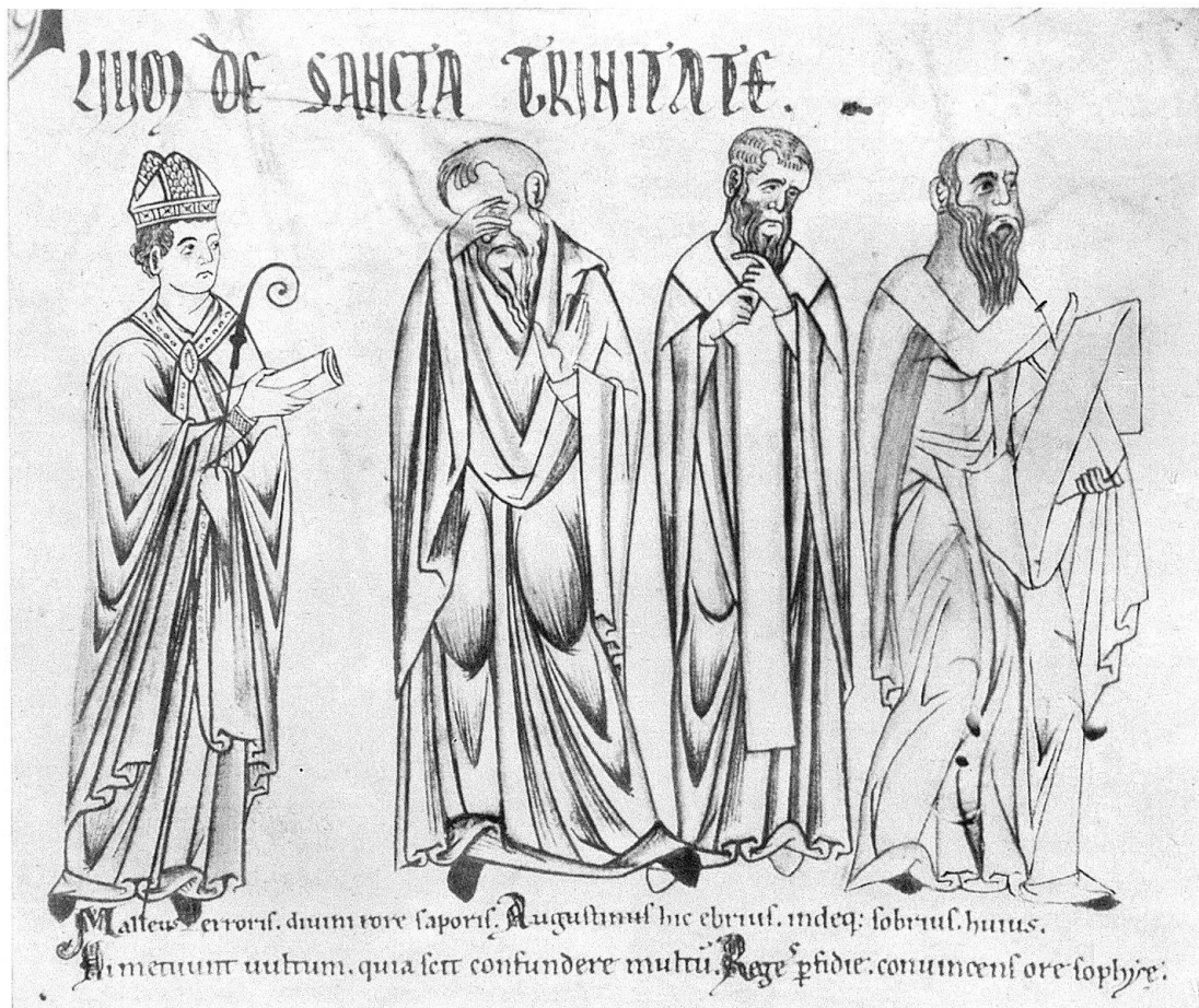
Abb. 7. Augustinus und die drei Häretiker. Aus Cod. 14. Vom Engelbergermeister gezeichnet