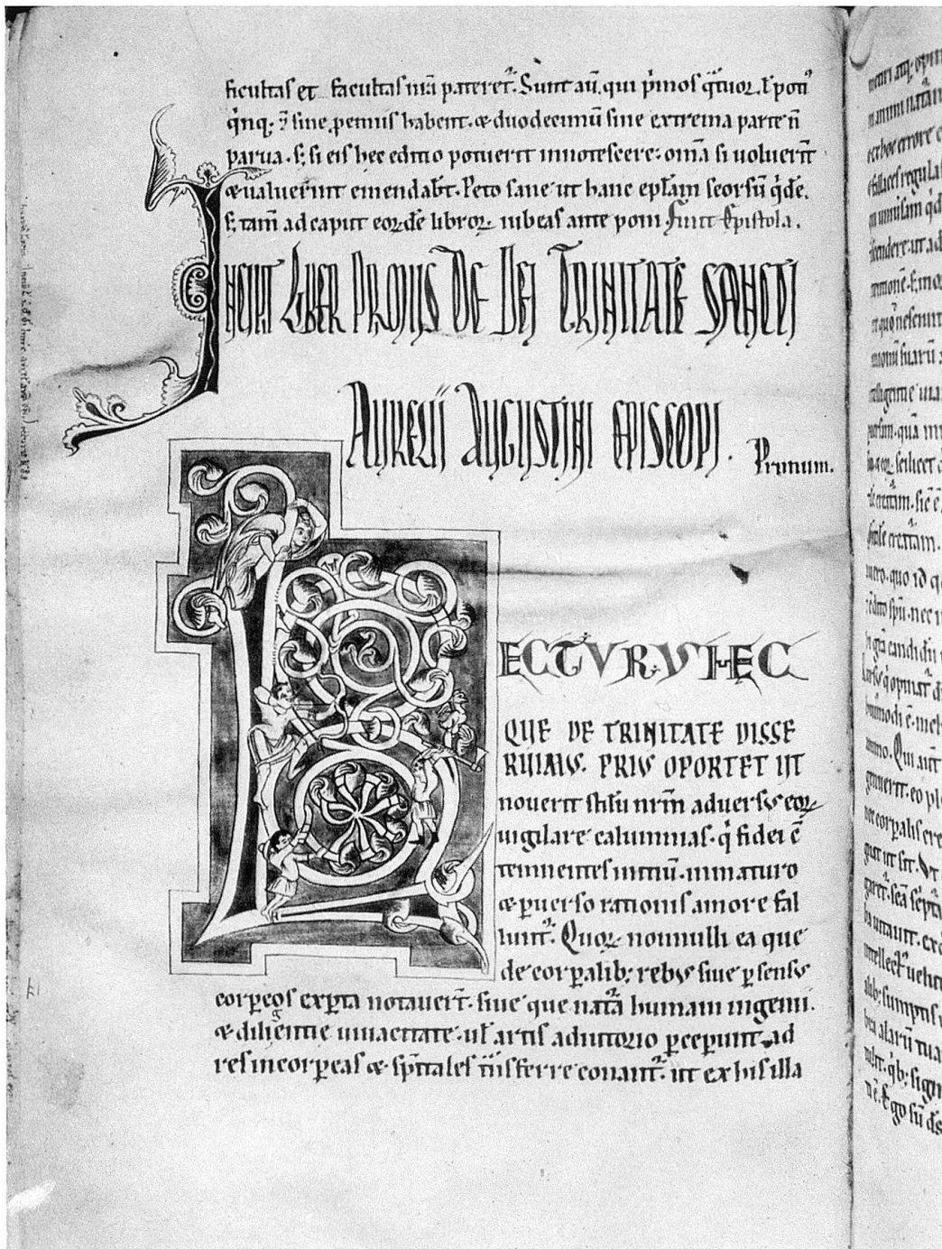
Abb. 8. Cod. 14. Anfang des 1. Buches mit trefflicher Gliederung der ganzen Seite Größe des Schriftbildes 28 x 17 cm

nicht kennen, vom sogenannten Berchtold- oder weil er ja auch noch unter Abt Heinrich gewirkt hat, allgemeiner vom Engelbergermeister. Durrer und nach ihm Güterbock sind seinem Schaffen mit ganz besonderer Liebe nachgegangen.