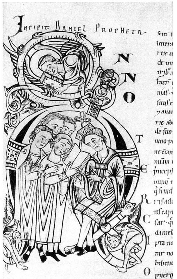
Abb. 6. Buchstabe A in Cod. 3. Der Band ist unter Frowin geschrieben worden, der Engelbergermeister hat jedoch die ursprüngliche Initiale ausradiert und sie neu geschaffen. (David erklärt Nabuchodonosor den Traum)