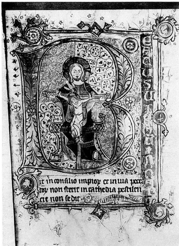
Abb. 12. Initiale B aus Cod. 60 Originalgröße 22 × 16 cm