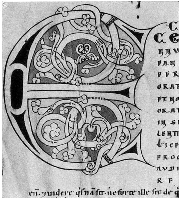
Abb. 5. Initiale E mit schwarzer Tinte gezeichnet; der Kern des Buchstabens ist rot, der Grund mehrfarbig

Hunc Augustini librum studiosa Frowini Sancta Maria tibi fecit devotio scribi.