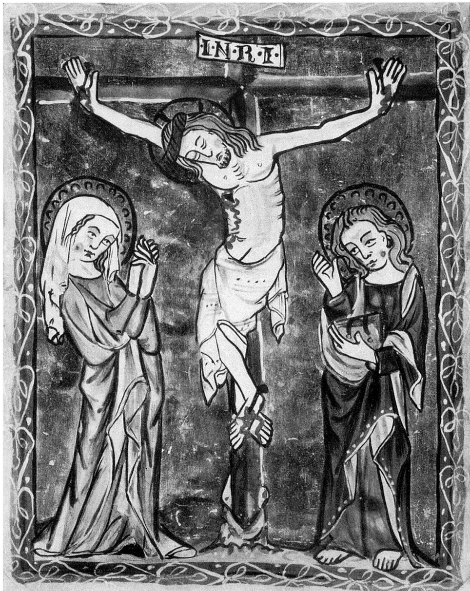
Abb. 11. Kreuzigungsbild in Deckfarbenmalerei auf Goldgrund, aus Cod. 60, erste Hälfte 14. Jahrhundert

rungswechsels fällt, so daß Durrer irrtümlicherweise Frowin selbst als den Hauptmaler der ersten Periode ansah. Statt der typischen runden Knollen laufen jetzt die Enden schnabel- oder noch besser krallenförmig aus. Die Blätter werden ausgezackt und die Buchstaben erhalten so eine bewegtere, bisweilen verschnörkelte, bizarre Ausführung. Großes aber hat der Engelbergermeister mit seinen reicher ausgeführten Zierbuchstaben geleistet. Kein Wunder, wenn er daran ging, wie