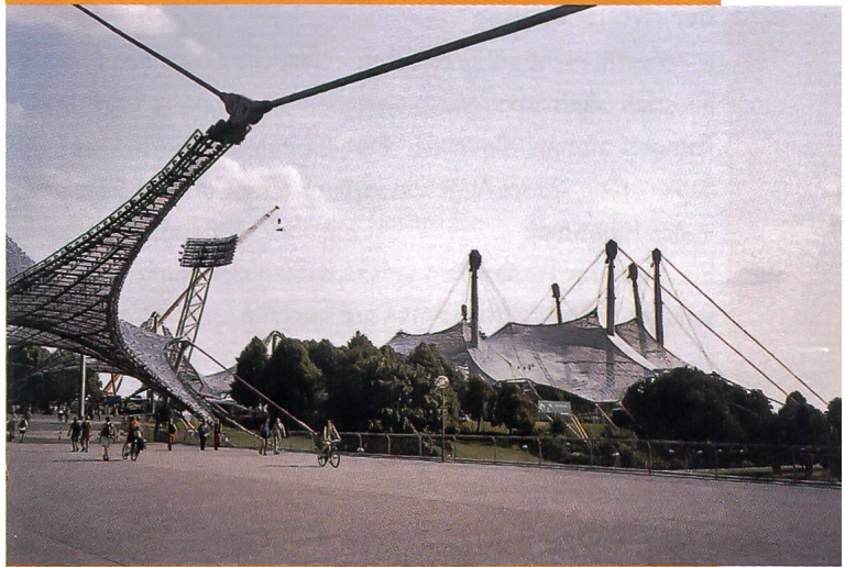
Das Stadion

Trotz müder Beine stand noch die «Lady's night» auf dem Programm. Die Party-Halle war zwar gigantisch gross doch denkbar ungeeignet, um Atmosphäre entstehen zu lassen. Mehrere, den Raum unterteilende Säulen zerstückelten das Ambiente. Im Mittelpunkt sollten die Frauen stehen. Doch leider sah in der Masse «sie vor lauter Sie's die Sie nicht mehr!» Es herrschte Reizüberflutung an interessanten Gesichtern. Ich wurde dabei immer müder, und sehnte mich nach einem Bett, um in die Welt der Träume entfliehen zu können.