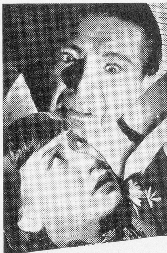
Anna May Wong und J. Carrol Naish spielen in dem Paramountfilm «Insel der Geächteten».

Man hatte gehofft, daß jetzt die vielen Filme, die in der vergangenen Saison beendet wurden und die man noch nicht vorgeführt hat, endlich erscheinen würden, namentlich Hauptwerke der Produktion wie «La Jaque», «L'Empreinte du Dieu» von Léonide Moguy, «Remorques» mit Jean Gabin, Michèle Morgan und Madeleine Renaud, «Duel mit Pierre Fresnay und Yvonne Printemps». Ob die Kopien verloren sind, ob die Zensur sie zurückhält oder die Verleiher sie nicht herausgeben wollen, weil die Theaterbesitzer sie nicht entsprechend hoch bezahlen können, ist nicht zu ergründen. Sicher ist jedoch, daß hier kostbares Gut verloren geht, daß auch diese neuen Filme, ehe man sie endlich vorführen wird, vielleicht schon überholt sein werden.