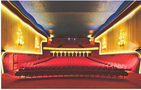
Lausanne → 8