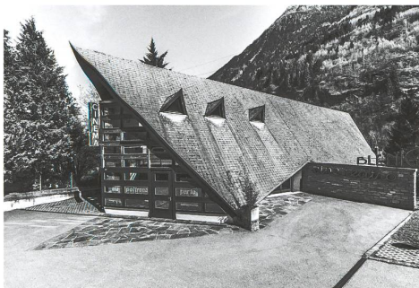
Blenio → 38