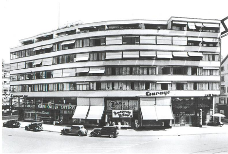
Zürich → 16