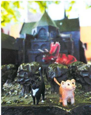
Auf den Spuren von Leo und Lila in Basel. Die faltbare Stadtkarte hilft bei der Orientierung.