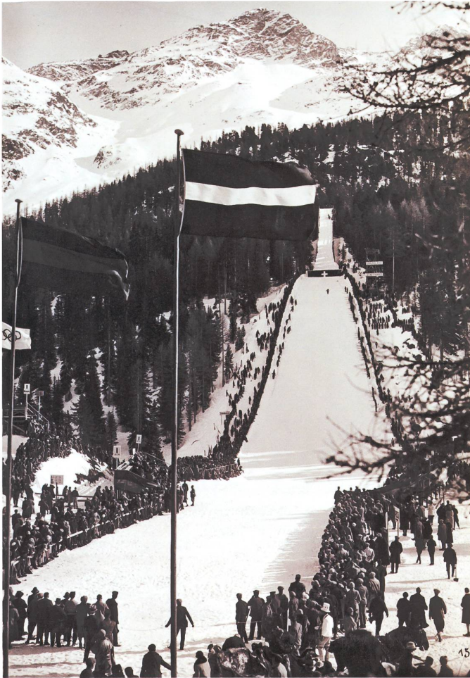
Die von Nicolaus Hartmann junior erbaute Olympiaschanze während der Winterspiele 1928.