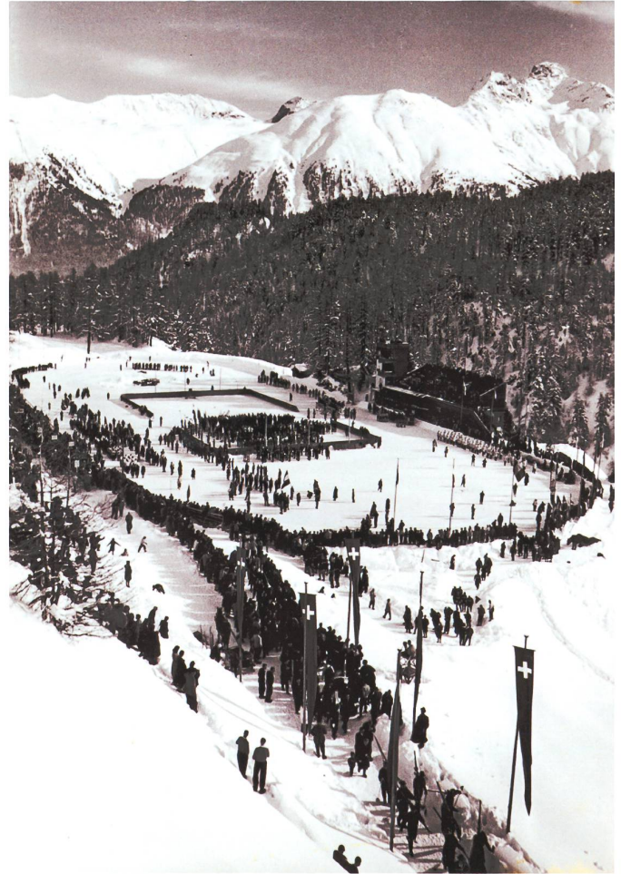
Das «Naturstadion» in St. Moritz anlässlich der Eröffnungsfeier der Olympischen Winterspiele von 1948.