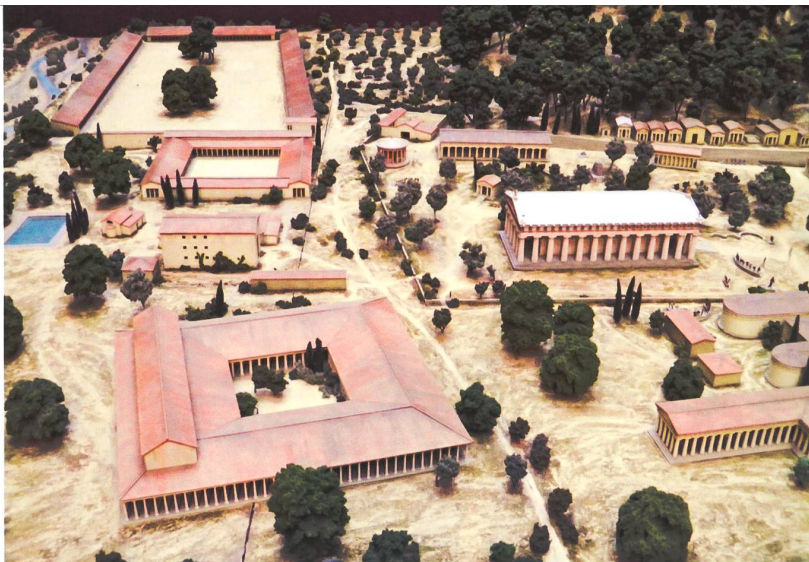
Modell im Massstab 1:200 der antiken Anlage von Olympia um 100 v. Chr. (Ausschnitt), British Museum, London.

von Lehrmitteln für den Turnunterricht, die in der ganzen Schweiz verwendet wurden. Die Kommission legte Normalien fest, das heisst, die Kantone und Gemeinden erhielten Bauvorschriften für die Turnhallen und die Geräteeinrichtungen. Der Eidgenössische Turnverein ETV übernahm ab Ende des 19. Jahrhunderts Aufgaben im Bereich der Ausbildung von Turnlehrern zusammen mit dem Schweizerischen Turnlehrerverein STLV. Dadurch erhielt das Turnen in seiner klassischen Form ein Gewicht, das sich im Turnhallenbau stark manifestierte. Die einschlägigen Geräte wie Reck und Schaukelringe beeinflussten die Masse einer Halle, und die übrigen Geräte, wie zum Beispiel der Barren, benötigten entsprechende Nebenräume. Auch Kletterstangen und Klettertaue gehörten zur Standardausrüstung, und Finanzierungsbeiträge des Bundes waren davon abhängig, dass gemäss den Normen gebaut wurde.