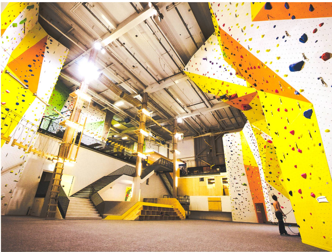
Kletterhalle in Winterthur. Da sich Klettern in den vergangenen Jahren zur Trendsportart entwickelt hat, wächst die Nachfrage nach solchen Bauten ständig. Hier kann wetterunabhängig trainiert werden.