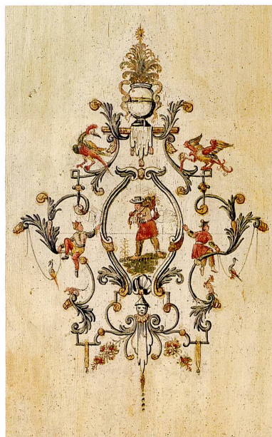
Fig. 7 Médaillon au palmier (10). Photo Dirk Weiss, 2018