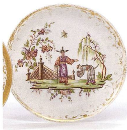
Fig. 13 «Le fumeur de pipe» (3), détail.