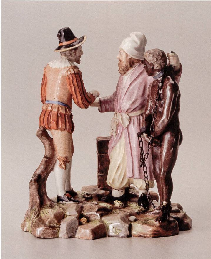
Abb. 6 Der Menschenhandel , um 1775, bunt bemaltes Porzellan, Porzellanmanufaktur Kilchberg-Schooren, 19 cm, Schweizerisches Landesmuseum, Zürich (HA 74 11.3.1903)