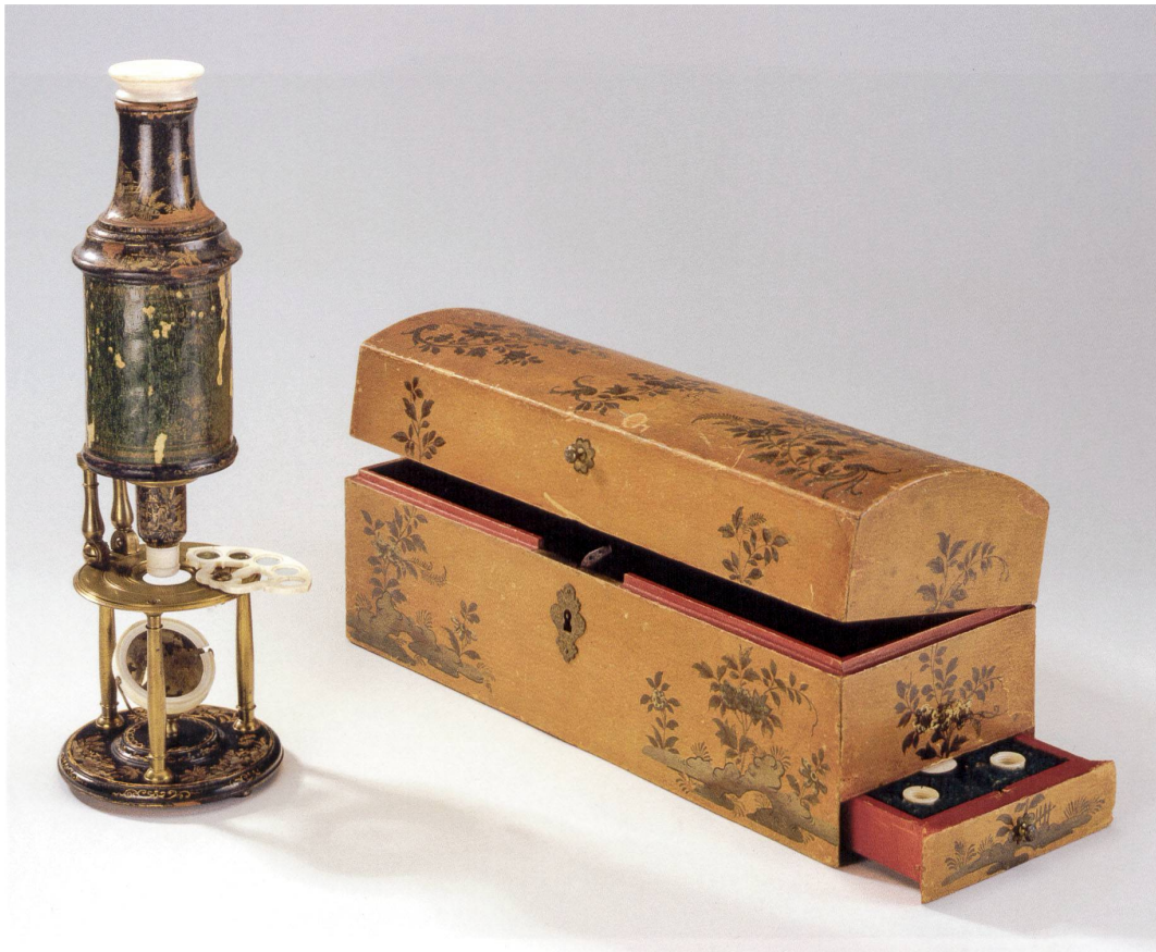
Abb.3 Mikroskop von Charles Bonnet (von Horace-Bénédict de Saussure gegeben), vermutlich J.-A. Nollet, Holz, Glas, Messing, Metal, Vernis Martin.

Qualität der asiatischen Waren, die europäische Käufer schätzten. So bestand die Herausforderung für Künstler und Kunsthandwerker darin, nicht nur stilistisch zu imitieren, was als vermeintlich chinesisch galt, sondern sich an fremdländischen Techniken zu messen. Bereits 1672 gründete die Pariser Akademie zu diesem Zweck die Abteilung «Ouvrages de la Chine» zur nachahmenden Anfertigung von Möbeln. Die Übersetzung bis hin zu einer Substituierung des fremdländischen Kunsthandwerks war ein Marktvorteil und transformierte die materielle Kultur Europas.