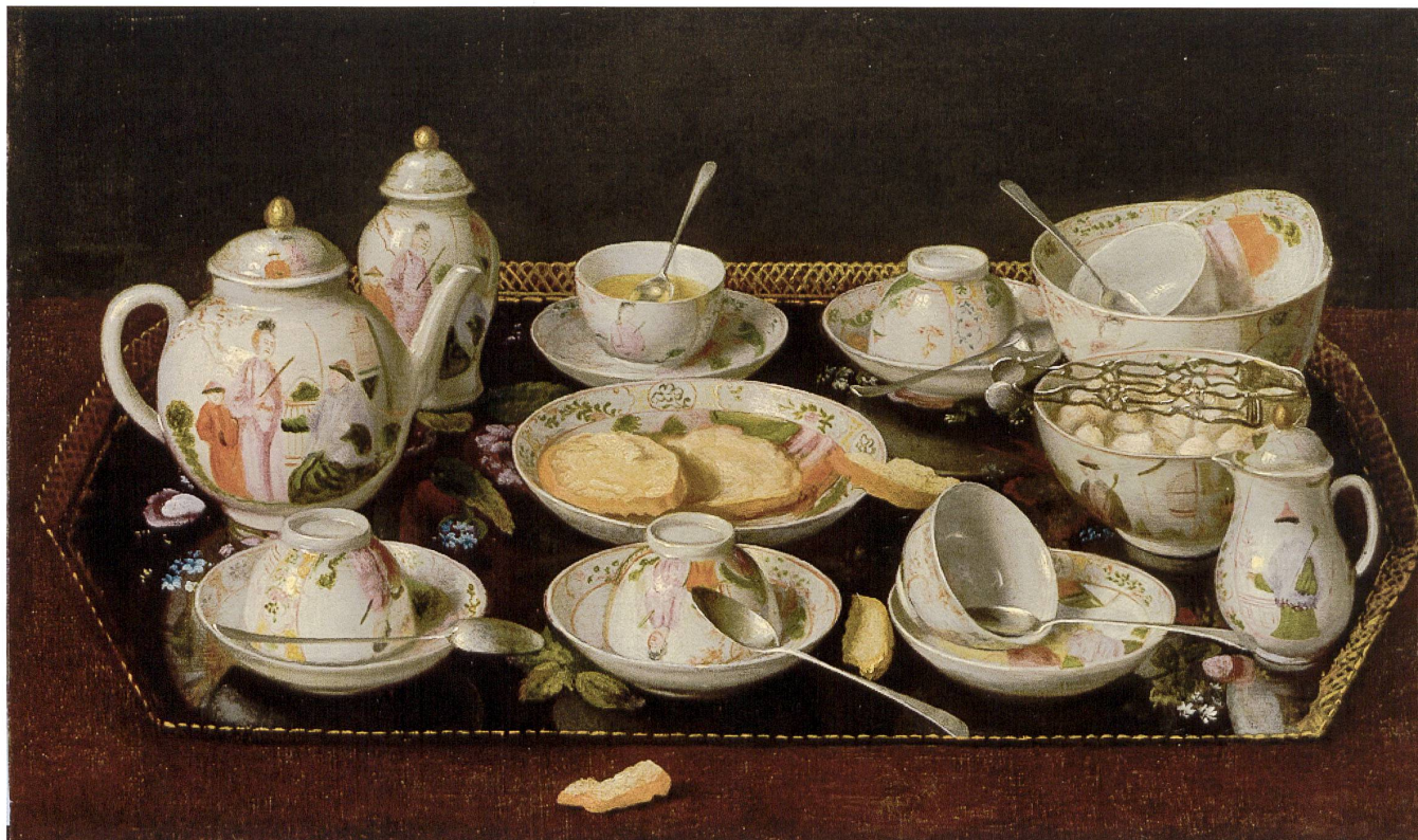
Abb. 4 Jean-Etienne Liotard, Stilleben mit Teeservice , um 1781, Öl auf Leinwand auf Holz montiert, 35,8×51,6 cm.

chinesischer und japanischer Porzellanstücke zusammengetragen und gründete die Meissner Porzellanmanufaktur, die nach anfänglicher Imitation chinesischer Ware und insbesondere der japanischen Imari- und Kakiemon-Dekors zunehmend einen eigenen Stil entwickelte.