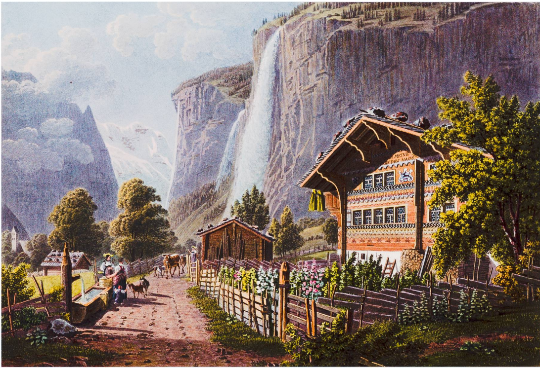
Abb. 1 Auf den Veduten der Schweizer Kleinmeister gehört das Chalet zur Ausstattung der alpinen Landschaft: Ansicht des Staubbachfalls von Gabriel Lory fils, 1822.