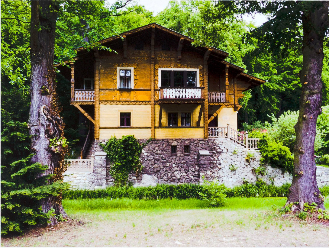
Abb. 4 Zwischen 1863 und 1867 lässt Prinz Carl von Preussen in der Parklandschaft des Jagdschlusses Glienicke ausserhalb von Berlin zehn Schweizerhäuser bauen. Vier sind bis heute erhalten und stehen unter dem Schutz des UNESCO-Welterbes.