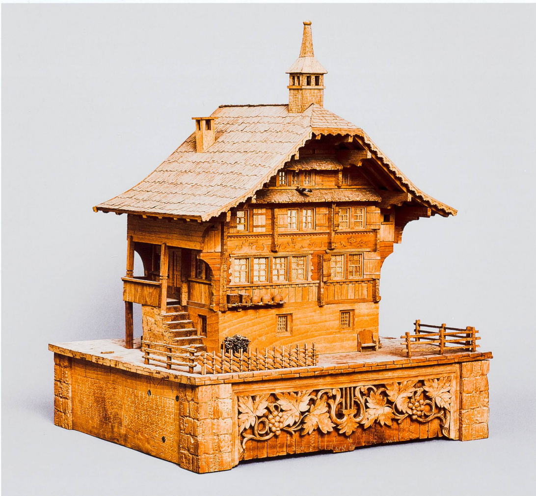
Abb. 2 Detailtreue Nachbildung eines Holzhauses aus dem Archiv der Firma Ed. Jobin AG, Brienz, vermutlich um 1870 hergestellt; Höhe ca. 40 cm.