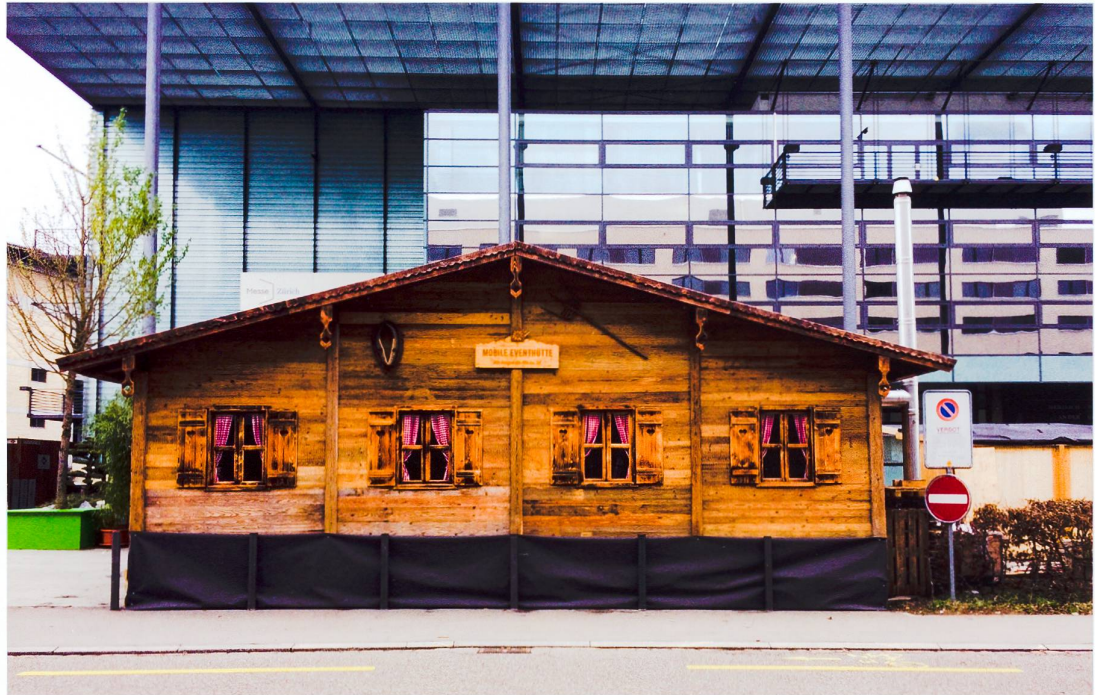
Abb. 12 Heute ist das Chalet zur «mobilen Eventhütte» geworden und bringt am Flughafen Kloten «die Alm ins Tal».

als Bilderrahmen. Auch sogenannte Bildbetrachter gibt es seit den 1950er Jahren in Form von Chalethäuschen. Bezeichnet werden diese Reiseandenken je nach Verkaufsort als «Schweizerhäuschen», «Schwarzwaldhaus» oder «Tiroler Chalet». Edelweiss und Alpenrose liefern den austauschbaren Dekor.