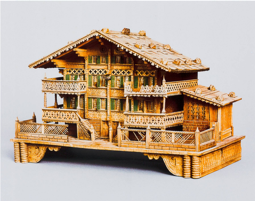
Abb. 5 Souvenirchalet aus dem Archiv der Firma Ed. Jobin AG, Brienz, vermutlich um 1890 hergestellt; Höhe ca. 40 cm.