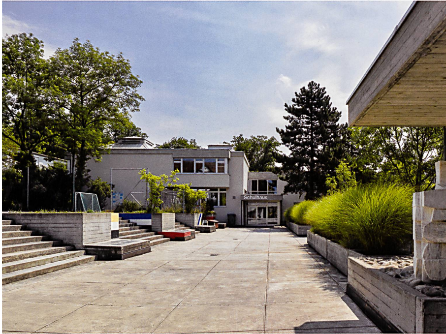
Haefeli, Moser, Steiger, Schule und Quartierhallen- bad Bungertwies, Zürich- Hottingen, 1961–1973. Foto Dirk Weiss, 2018

Von der Mitte der 1950er Jahre an entwickelte die Pro Juventute zusammen mit der Zürcher Stadtverwaltung ein Programm, das in der Realisierung eines Netzes von Gemeinschaftszentren für Personen aller Altersgruppen auf dem gesamten Stadtgebiet münden sollte. Die Beweggründe waren nicht nur pädagogischer und sozialer Natur: Angesichts des zunehmenden Platzmangels in der Stadt und der entsprechenden Steigerung der Grundstückspreise erwies sich die Kombination von Freizeitanlagen mit anderen Einrichtungen wie Parks, Freibädern, Sportplätzen, Bibliotheken oder Theatern gegenüber der Einrichtung einzelner und auf die jeweiligen Altersgruppen aufgeteilter Freizeitanlagen auch als vorteilhafter. Überdies konnte man mit den richtigen architektonischen Kunstgriffen flexible Räume schaffen, die sowohl für den Unterricht wie auch für die Freizeit nutzbar waren. Von wirtschaftlichen und sozialen Überlegungen angetrieben, förderten Lokalpolitiker wie auch private Vereinigungen so gemeinsam das Konzept eines Netzes von Freizeiteinrichtungen, die baulich mit den Schulen verbunden waren. Entsprechend wurden Architektur und städtebauliche Einbettung von Schulhäusern mit Blick auf deren neue Rolle als lebhaftes und aktives Freizeitzentrum überdacht.