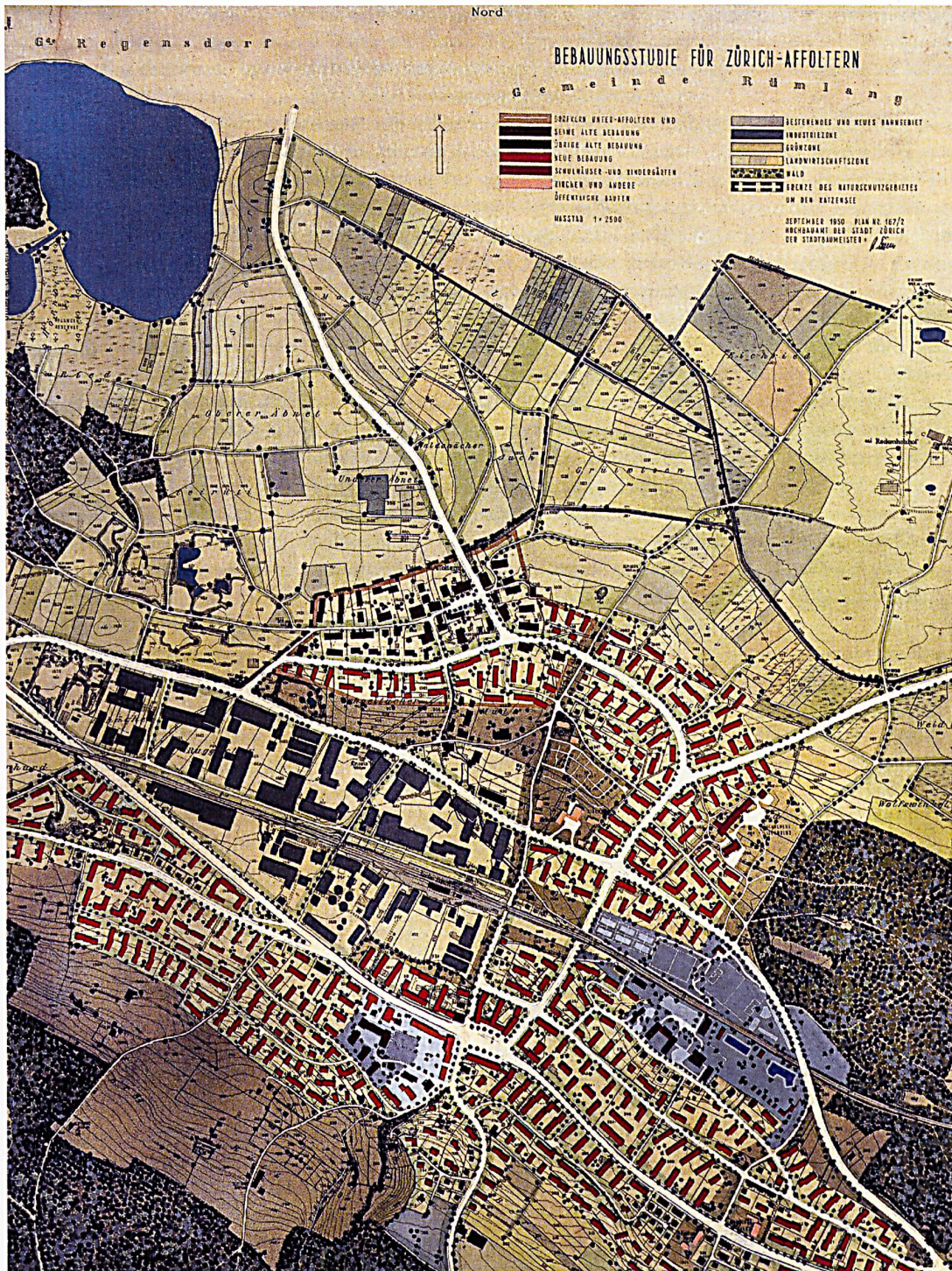
Albert Heinrich Steiner, Bebauungspläne Zürich-Affoltern, 1950. Für die Schulbauten werden grosszügige Grünflächen vorgesehen.

disponiert und von Grünflächen umgeben wurden, waren sie keine isolierten städtebaulichen Elemente mehr; vielmehr sollten sie sich in das jeweilige Quartier integrieren und den Einwohnern im Sinn einer erweiterten Vorstellung von Pädagogik eine Reihe von Dienstleistungen bieten.