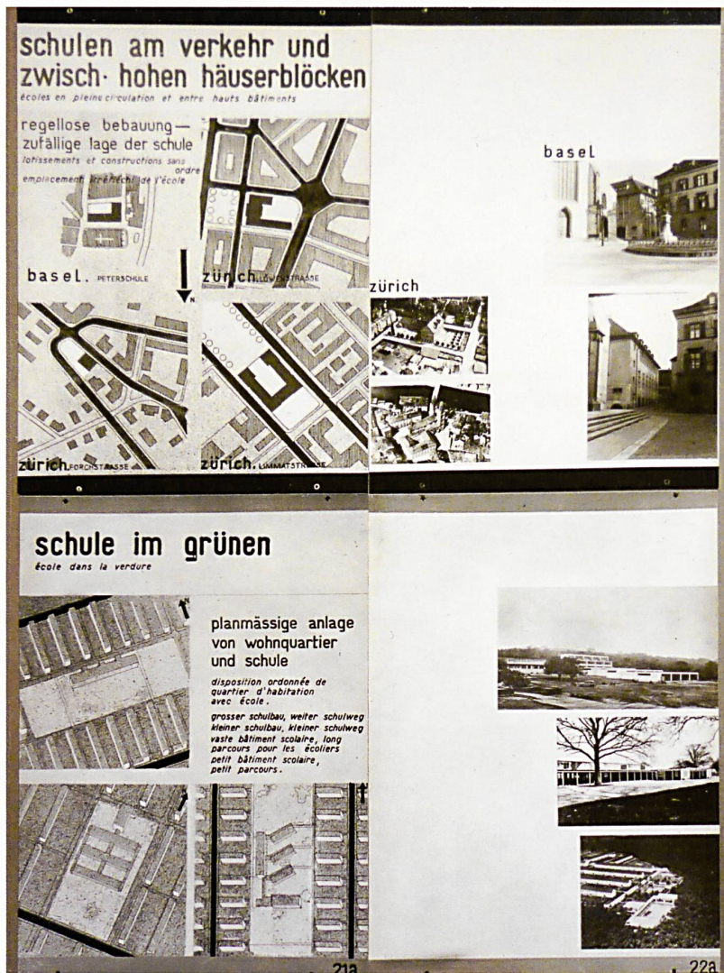
Beispiel und Gegenbeispiel für die Anordnung von Schulhäusern im städtebaulichen Kontext, gezeigt an der Ausstellung «Der neue Schulbau», Kunstgewerbemuseum Zürich, 1932.

Schulhäuser sind keine isolierten Einsprengsel im Stadtgefüge, sondern integrale Bestandteile der Stadt, die mit ihrem Kontext in wechselseitiger Beziehung stehen. Oft im Zentrum eines Wohnquartiers angelegt, wurden Schulhäuser im Lauf des 20. Jahrhunderts zu eigentlichen Beziehungsräumen, die gleichzeitig gesellschaftliche Leitbilder und Ideale vermitteln.