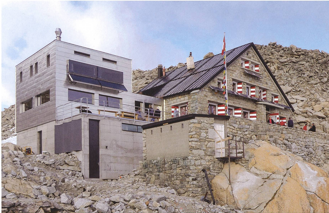
Cabane de Trient , par leur architecture très différente chaque volume exprime les paradigmes de son époque.

grands dortoirs, toilettes extérieures et réfectoire muni d'une cuisine sommaire – s'est avérée salvatrice pour fidéliser une clientèle devenue plus exigeante. La norme tend désormais à la réalisation de chambres insonorisées de quatre à huit personnes, de sanitaires avec WC et douches alimentées en eau chaude et d'une cuisine professionnelle capable d'offrir un service en demi-pension.