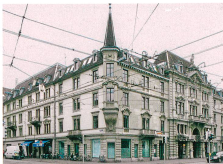
Zürich → 14