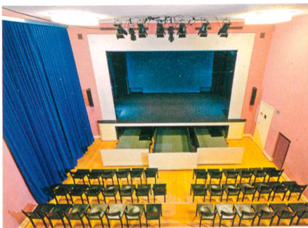
San Materno → 8