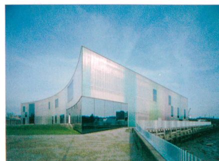
London → 50