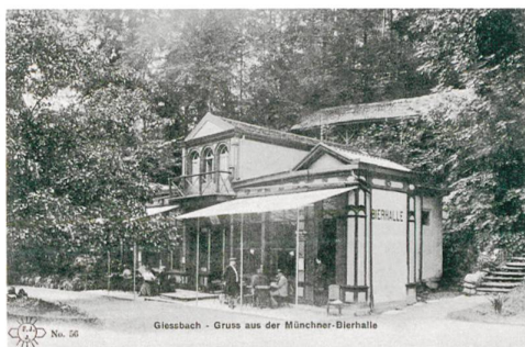
Abb. 9 Die Bierhalle am heutigen Weg zwischen Personalhaus und Hotel.

In den 1870er Jahren, der Zeit des Hotelbaus am Giessbach, standen die Aussichtshotels in der Gunst der Touristen: 1869 wurde das durch den Besuch der englischen Königin Victoria berühmt gewordene Hotel Axenstein eröffnet, 1874 das Hotel Axenfels oberhalb von Brunnen, 1873 auf dem Bürgenstock ein erstes Grosshotel. Im Eröffnungsjahr des neuen Giessbachhotels 1875 entstanden das Kurhaus auf dem Beatenberg über dem Thunersee «nach dem Vorbild der Anstalten in Davos» und das mächtige Hotel Schreiber auf Rigi-Kulm nach Plänen des Giessbach-Architekten Horace Edouard Davinet (Abb. 11). 10 ▶