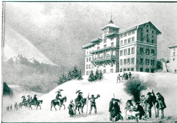
Abb. 7 Das 1857 eröffnete «Hotel Regina Montium» von Architekt Ferdinand Stadler auf Rigi-Kulm. Lithografie von 1858. (aus: Flückiger-Seiler 2001, Abb. 170)

über den Seen als Hotelstandorte entdeckt. So entstand auf dem von Touristen richtiggehend gestürzten Rigi-gipfel 1857, im Baujahr des Giessbach-Hotels, bereits ein zweites grosses Hotelgebäude Regina Montium nach den Plänen des Zürcher Architekten Ferdinand Stadler (Abb. 7). Zwei Jahre früher hatte der Weinbrenner-Schüler Philippe Franel in Glion oberhalb Montreux, mit atemberaubendem Blick auf den Genfersee, das Hôtel du Righi Vaudois erbaut.