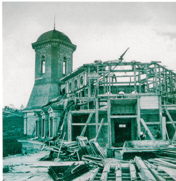
Abb. 15 Das Hotel Schreiber auf Rigi-Kulm wurde 1952 im Rahmen der Aktion «Säuberung des Rigi-Gipfels» abgebrochen. (aus: Flückiger-Seiler 2005, Abb. 47)