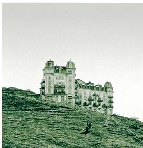
Abb. 11 Das 1875 eröffnete Hotel Schreiber auf Rigi-Kulm war ebenfalls ein Entwurf des als Hotelarchitekt bekannten Horace Edouard Davinet. (aus: Flückiger-Seiler 2001, Umschlagbild)