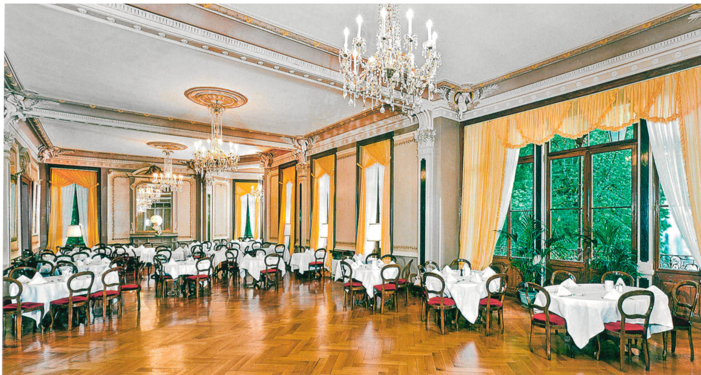
Abb. 16 Grosser Speisesaal.

der kostbaren Säle investierte. 1989 konnten die Arbeiten mit der Restaurierung der Belle-Epoque-Säle im Erdgeschoss abgeschlossen werden (Abb. 16). Als Krönung der Bemühungen erhielt das Hotel Giessbach 2004 die Auszeichnung als «Historisches Hotel des Jahres».