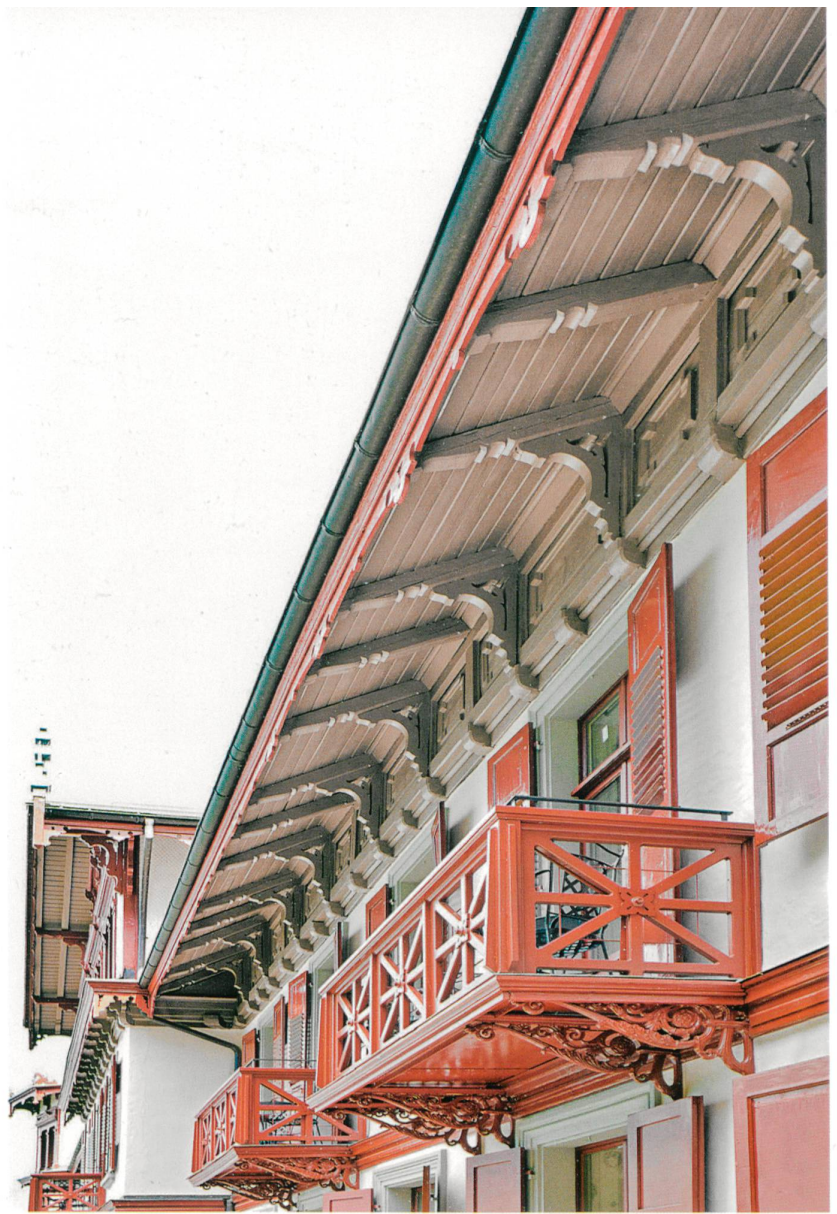
Abb. 14 Zierformen an der Fassade von 1884 im «Schweizer Holzstil».