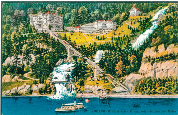
Abb. 13 Die Anlage am Giessbach in einer frei komponierten und farbig kolorierten Postkarte um 1900. Von links nach rechts sind sichtbar: das Hotel der Familie Hauser in der Neugestaltung nach dem Wiederaufbau 1884, davor die Bergstation der 1879 eröffneten Drahtseilbahn. Die gedeckte Wandelbahn führt, vorbei an der Münchner Bierhalle, zum älteren Hotelbau von 1857 (im Zustand nach den Erweiterungen zum fünfachsigen Gebäude), rechts oberhalb ins Bild retouchiert ist das 1877 eröffnete Hotel Beau-Site . (Archiv Hotel Giessbach)

Auf die Sommersaison 1879, vier Jahre nach Eröffnung seines neuen Hotels, nahm Carl Hauser eine hoteleigene Standseilbahn in Betrieb, die den Gästen den Aufstieg von der Schiffstation zum Hotel erleichterte. Es war die zweite Standseilbahn in der Schweiz, die erste fuhr seit zwei Jahren zwischen der Stadt Lausanne und Ouchy. Als Weltneuheit erhielt sie in der Mitte der Strecke, auf der grossen eisernen Brücke, eine automatische Ausweiche. Der zeitgenössische Baedeker beruhigt allfällige Skeptiker der neuen Bahn mit den «guten Bremsvorrichtungen dank den Zahnstangen wie bei der Rigibahn». Sogleich wurde die Hotelbahn zur vielbeachteten Attraktion, die in der zeitgenössischen Fachpresse eine grosse Publizität erlangte und die viel zur grossen Bekanntheit der Hotelanlage am Giessbach beigetragen hat (Abb. 12, 13). 11