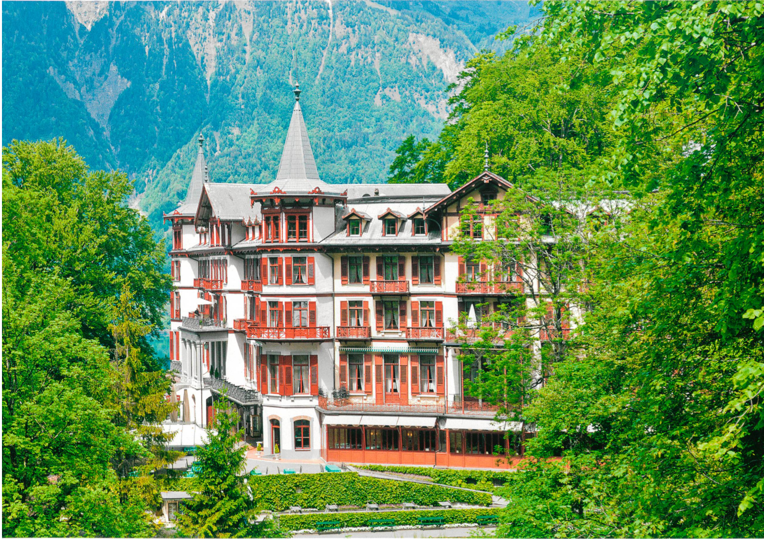
Abb. 1 Ansicht des Hotels in der neuen Gestaltung von 1884. Foto 2011 mit der nach Befund wiederhergestellten Farbfassung von 1913.