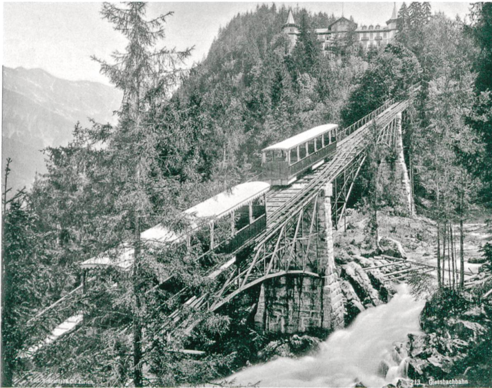
Abb. 12 Die beiden Wagen der 1879 eröffneten Drahtseilbahn auf dem imposanten Eisenviadukt über dem Wasser.