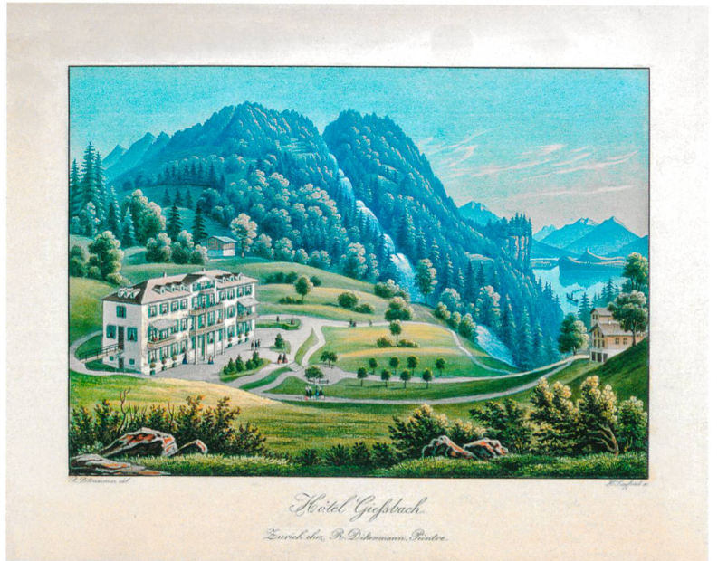
Abb. 5 Das 1857 eröffnete, vom Berner Architekten Friedrich Studer entworfene, erste Hotel am Giessbach mit der von Eduard Schmidlin gestalteten ersten Gartenanlage. Aquatinta von Samuel Dikenmann.