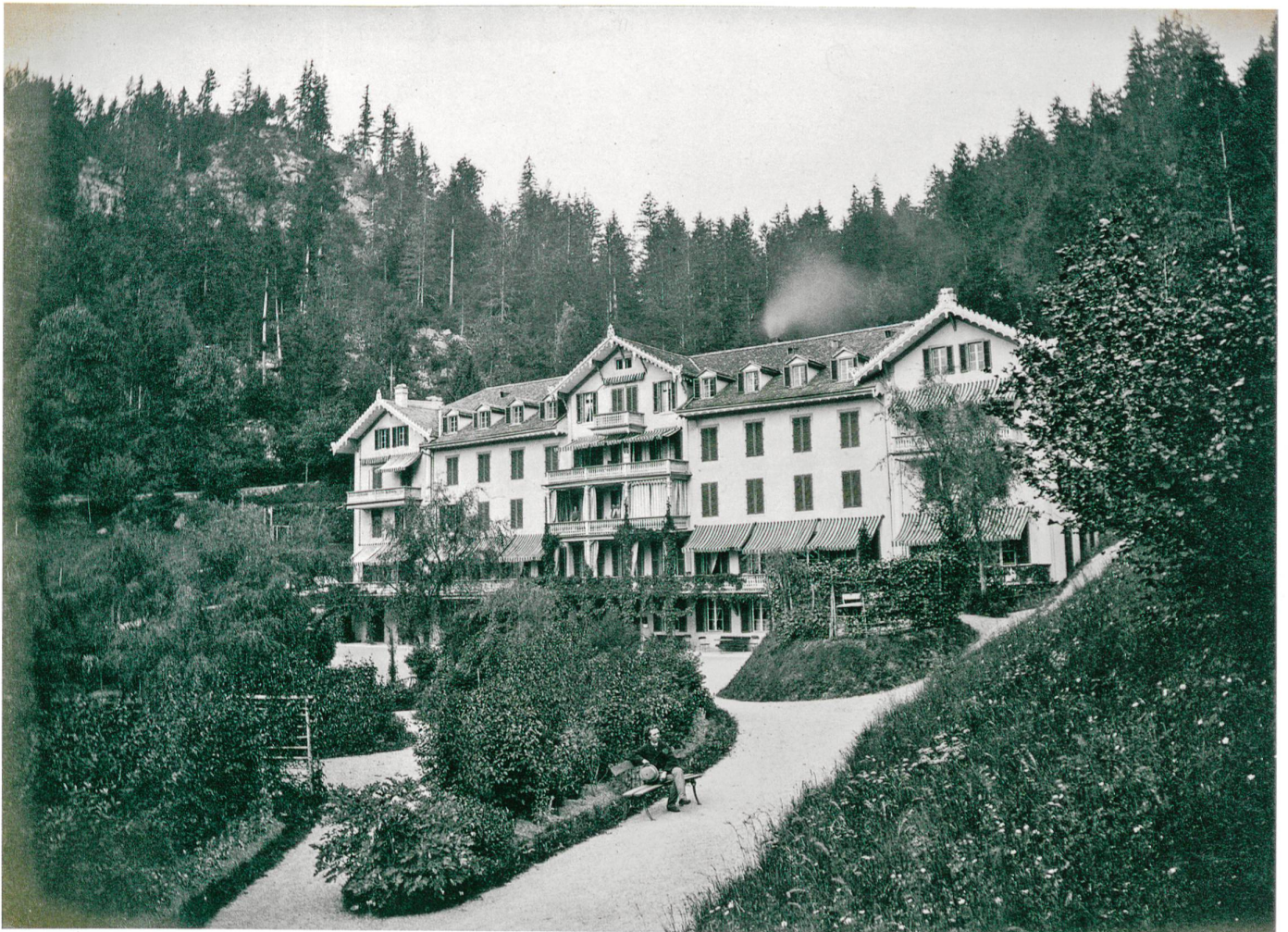
Abb. 6 Fotografie des ersten Hotels von 1857 nach dem Anbau der Seitenflügel (um 1860) und der Aufstockung des Gebäudes (1862/63).